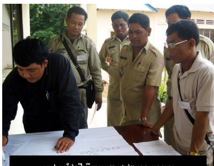
អាជ្ញាធរដែនដីធ្វើការរួមគ្នាក្នុងវគ្គបណ្តុះបណ្តាល

ជាលទ្ធផល ដែលអនុញ្ញាតឱ្យអាជ្ញាធរមូលដ្ឋានដែលសុទ្ធសឹងជាសមាជិកគណៈបក្សប្រជាជនកម្ពុជា ធ្វើការជ្រើសរើសជនបង្គោល មន្ត្រីទាំងអស់នោះបានជ្រើសរើសស្ត្រី ដែលសុទ្ធសឹងជាសមាជិករបស់គណៈបក្សប្រជាជនឱ្យចូលរួម ។ ជនបង្គោលដែលបានជ្រើសរើសពុំមានលក្ខណៈលាយចំរុះគ្នាគ្រប់គ្រាន់នោះទេ ហើយយើងពិបាកក្នុងការនិយាយថា តើអ្នកដែលត្រូវបានជ្រើសរើសនោះ ជាអ្នកតំណាងឱ្យស្ត្រីក្នុងសហគមន៍ដ៏ធំរបស់ពួកគេឬក៏អត់ ។