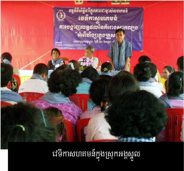
វេទិកាសហគមន៍ក្នុងស្រុកអង្គស្នួល

វេទិកានេះមានគោលបំណងបង្ហាញនូវមតិយោបល់នានាពីអ្នកចូលរួមទាំងអស់ ស្តីពីវិវត្តបណ្តុះបណ្តាល និងគំរោងសាកល្បង បានបង្ហាញនូវលទ្ធផល និងធ្វើសេចក្តីសន្និដ្ឋានលើការវាយតម្លៃ។ លទ្ធផលនៃការវាយតម្លៃត្រូវបានបង្ហាញដល់អ្នកចូលរួមក្នុងគំរោងសាកល្បង តាមរយៈការសំដែងល្ខោនរឿងខ្លី (Drama) ដែលរួមបញ្ចូលទាំងលទ្ធផល និងយោបល់ពីសំណាក់សមាជិកសហគមន៍។ អត្ថបទរឿងល្ខោនខ្លីមាននៅក្នុងឧបសម្ព័ន្ធទី១ ។