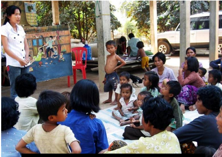
វគ្គលើកកម្ពស់ការយល់ដឹងក្នុងសហគមន៍

ជនបង្គោលបានបើកវគ្គបណ្តុះបណ្តាល ផ្លូវការ និងក្រៅផ្លូវការ ដើម្បីលើកកម្ពស់ការ យល់ដឹងស្តីពីអំពើហិង្សាលើស្ត្រី ។ វគ្គក្រៅផ្លូវ ការធ្វើឡើង ដោយបានការចូលរួមពីសមាជិក សហគមន៍ជាង ៩៥៨នាក់ ។ វគ្គនេះធ្វើឡើង នៅតាមទីផ្សារ តាមរយៈការពិភាក្សាលើបញ្ហា អំពើហិង្សាលើស្ត្រី ក្នុងអំឡុងពេលសំរាកទទួល ទានអាហារ និងការសន្ទនាជាមួយអ្នកជិតខាង មិត្តភ័ក្ត និង ក្រុមគ្រួសារ ។