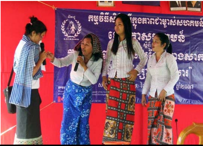
អាកល្នានដែលបានសំដែងក្នុងវេទិការសហគមន៍នៅស្រុកអង្គស្នួល