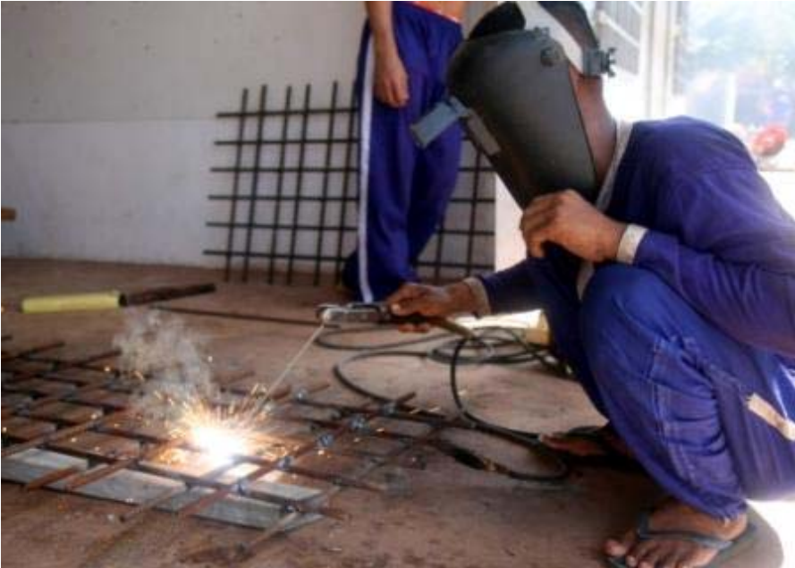
អ្នកទោសក្នុងពន្ធនាគារខេត្តព្រះសីហនុ ចូលរួមក្នុងវគ្គបណ្តុះបណ្តាលជាជាងផ្សារដែក ក្រោមការជួយឧបត្ថម្ភពីមូលនិធិជនប៊ូសសូ

លីកាដូគាំទ្រចំពោះផែនការរបស់អគ្គនាយកដ្ឋានពន្ធនាគារក្នុងការផ្លាស់ប្តូរពី ពន្ធនាគារដាក់ទណ្ឌកម្មទៅជា ពន្ធនាគារស្តារនីតិសម្បទាវិញ។ ការបណ្តុះបណ្តាលជំនាញ គឺជាផ្នែកមួយដ៏សំខាន់នៅក្នុងគ្រប់កិច្ចប្រឹងប្រែងស្តារនីតិសម្បទាទាំងអស់។ លើសពីនេះទៅទៀត ការបញ្ចេញអ្នកទោសក្រៅអាគារឃុំឃាំងដើម្បីធ្វើហត្ថកម្ម ពលកម្ម ឬ បណ្តុះបណ្តាលវិជ្ជាជីវៈ គឺជាតំរូវការយ៉ាងខ្លាំងនៃផ្នែកសុខភាពរបស់អ្នកទោស។