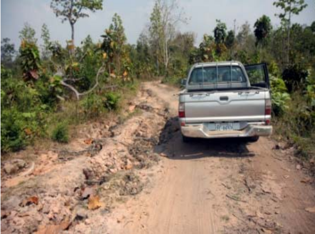
នេះជាជម្រើសផ្លូវចុងក្រោយ ទៅកាន់ ម៤។ ស្ថានភាពនេះ ធ្វើឱ្យមាន ការលំបាកដល់គ្រួសារ និងមិត្តភក្តិទៅសួរសុខទុក្ខអ្នកទោស

ប្រព័ន្ធពន្ធនាគារកម្ពុជាជាពេលបច្ចុប្បន្ន មានការខ្វះខាតនូវថវិកាដើម្បីផ្តល់ឱ្យអ្នកទោសឱ្យបានសមរម្យ។ ដូចនេះ អ្នកទោសទាំងឡាយច្រើនតែពឹងផ្អែកទៅលើ គ្រួសារ សាច់ញាតិ មិត្តភក្តិ និងអង្គការនានា ជួយឧបត្ថម្ភ