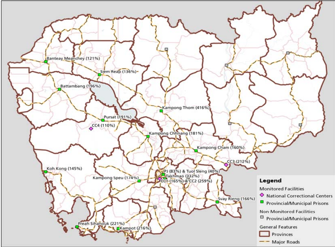
ពន្ធនាគារទាំង១៨ ដែលឃ្នាំមើលដោយអង្គការលីកាដូ (អត្រាតុលេខឃ្នាំឃាំង)

ជាគោលការណ៍ លីកាដូ សូមគាំទ្រចំពោះសកម្មភាពអប់រំ និងកែប្រែដោយហេតុថាការស្តារនីតិសម្បទា គឺជានិច្ចកាល ជាផ្នែកមួយយ៉ាងសំខាន់នៅក្នុងគ្រប់ប្រព័ន្ធព្រហ្មទណ្ឌទាំងអស់ ។ ប៉ុន្តែ គន្លឹះសំខាន់ដែលនាំឱ្យកម្មវិធី ស្តារនីតិសម្បទានេះដំណើរការទៅបានដោយជោគជ័យ គឺអាស្រ័យទៅលើការមានគម្រោងការងារលំអិត និងការ