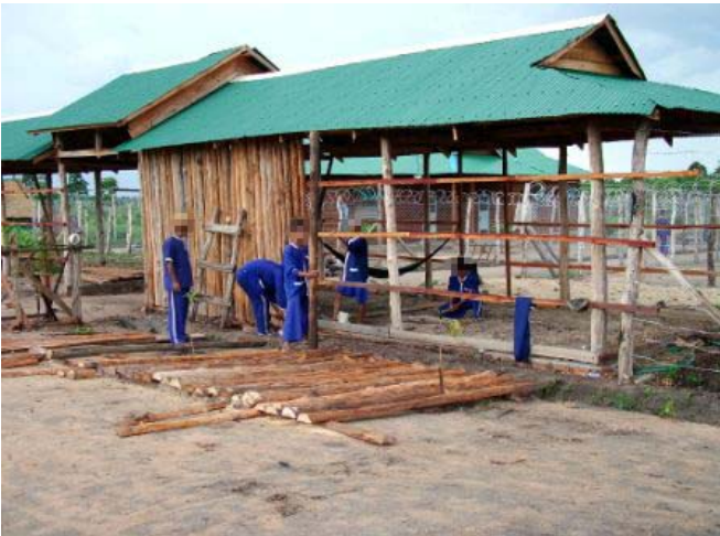
ពលកម្មអ្នកទោសកំពុងត្រូវបានប្រើប្រាស់ក្នុងការសាងសង់ពន្ធនាគារ ម៤

ច្បាប់កម្ពុជាបានចែងយ៉ាងជាក់លាក់ អំពីការហាមឃាត់មិនឱ្យប្រើប្រាស់ពលកម្មពន្ធនាគារដើម្បីប្រយោជន៍ ឯកជនឡើយ ៣៦ ។ ចំណែកច្បាប់អន្តរជាតិ វិញ ជាពិសេសអនុសញ្ញាអន្តរជាតិលេខ ២៩ បានចែង នូវការហាមឃាត់ដូចគ្នានេះដែរ ៣៧ តែទោះយ៉ាង ណា ក៏នៅមានករណីលើកលែងផងដែរ តែវាត្រូវ បានកំណត់ន័យយ៉ាងចង្អៀតបំផុត ។