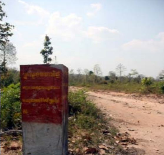
បង្គោលប្រាំផ្លូវ ចូលទៅមណ្ឌលអប់រំកែប្រែទី៤ ។ ពន្ធនាគារនេះ មានផ្ទៃដីសរុប៨៤៦ ហិកតា ដែលផ្ទៃកន្លះជាដីព្រៃ ។ ផ្ទៃកន្លះនៃ ដីនោះនឹងប្រើសម្រាប់ធ្វើកសិកម្ម

អគ្គនាយកដ្ឋានពន្ធនាគារ នៃក្រសួងមហាផ្ទៃបាន ធ្វើការសិក្សាអំពីគម្រោងកសាងពន្ធនាគារកសិកម្មនៅ ខេត្ត ពោធិ៍សាត់ ដែលត្រូវចំណាយពេលយ៉ាងឆាប់ក៏ពីរឆ្នាំដែរ ។ ពិធីបញ្ចុះបង់មូលដ្ឋានប្រព្រឹត្តទៅកាលពីខែសីហា ឆ្នាំ២០០៩ កន្លងទៅ ហើយពន្ធនាគារនេះចាប់ផ្តើមដំណើរ ការដំបូងបង្អស់នៅថ្ងៃទី១៧ ខែមករា ឆ្នាំ២០១០ ហើយក៏ ជាថ្ងៃលើកដំបូងនៃការមានវត្តមានអ្នកទោសបានមកដល់ ទីនោះ ។