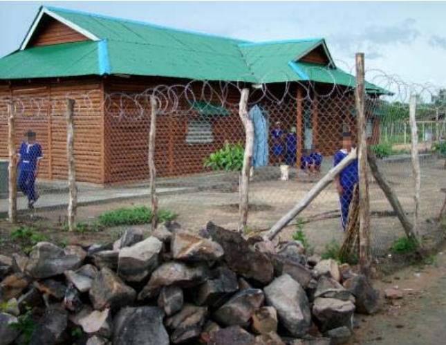
បន្ទប់អគារនៃមណ្ឌលអប់រំកែប្រែទី៤

ប្រព័ន្ធពន្ធនាគារកម្ពុជា ទទួលបាននូវភាពពិបាកយ៉ាងធ្ងន់ធ្ងរពីបញ្ហាចង្អៀតណែនខ្លាំង និងអគារចាស់ទ្រុឌទ្រោម ។ អគ្គនាយកដ្ឋានពន្ធនាគារ បានរាយការណ៍កាលពីខែមីនា ឆ្នាំ២០១០ កន្លងទៅនេះថា ប្រព័ន្ធពន្ធនាគារទាំងមូលកំពុងឃុំឃាំងអ្នកទោសសរុបទាំងអស់ ១៣.៣២៥ នាក់ ស្មើនឹង ១៦៧% នៃលទ្ធភាពផ្ទុកអ្នកទោសនៃពន្ធនាគារសរុបដែលអាចដាក់បានត្រឹមតែ ៨.០០០នាក់ ប៉ុណ្ណោះ។ ពន្ធនាគារទាំង១៨ ដែលលីកាដូបានឃ្នាំមើលក្នុងពេលបច្ចុប្បន្ននេះ មានអ្នកទោស សរុបចំនួន ១២.៦៤៦ នាក់ គិតត្រឹមខែមិថុនា ឆ្នាំ២០១០ កន្លងទៅនេះ ដែលស្មើនឹង