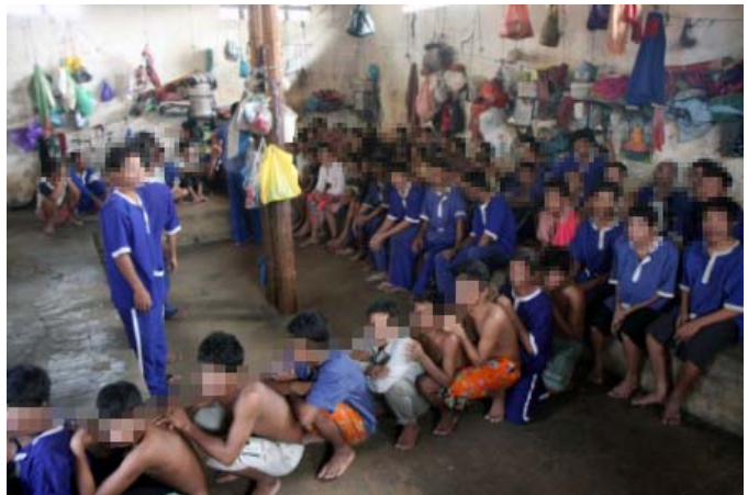
បន្ទប់អ្នកទោសបុរសនៃពន្ធនាគារខេត្តកំពង់ធ្នូកម្ពុជា ១០០នាក់ លើសពីសមត្ថភាពពីរដង ចំណែកអ្នកទោសបុរសផ្សេងគេនៅក្រៅបន្ទប់ក្រោមតង់

នៅចន្លោះខែធ្នូ ឆ្នាំ២០០៨ និងខែធ្នូ ឆ្នាំ២០០៩ លីកាដូ បានកត់សំគាល់ឃើញស្ថិតិអ្នកទោសមានការកើនឡើងចំនួន ១៥.៥% នៅក្នុង ពន្ធនាគារទាំង ១៨ ដែលលីកាដូបានឃ្នាំមើល។ នៅក្នុងកំឡុងពេលពីខែធ្នូ ឆ្នាំ២០០៧ និងខែធ្នូ ឆ្នាំ២០០៨ ចំនួនអ្នកទោសកើនឡើងត្រឹម ៩.៧% ប៉ុណ្ណោះ។ តាំងពីឆ្នាំ២០០៤ រហូតមក ចំនួនអ្នកទោសក្នុងពន្ធនាគារកើនឡើងស្ទើរទ្វេដង។ ត្រឡប់ទៅខែធ្នូ ឆ្នាំ១៩៩៩ ពន្ធនាគារដែលឃ្នាំមើលដោយលីកាដូ មានចំនួនប្រមាណតែ ៣.៥០០នាក់ ១០ មានន័យថា ចំនួនអ្នកទោសបានកើនឡើងស្ទើរតែ ៣៥០%ក្នុងរយៈពេល១០ឆ្នាំ ១១ ។ តារាងខាងក្រោមនេះ បង្ហាញនូវការកើនឡើងជាលំដាប់នូវចំនួនអ្នកទោស ក្នុងរយៈពេលប្រាំឆ្នាំនៅពន្ធនាគារ ដែលអង្គការលីកាដូ បានឃ្នាំមើល: