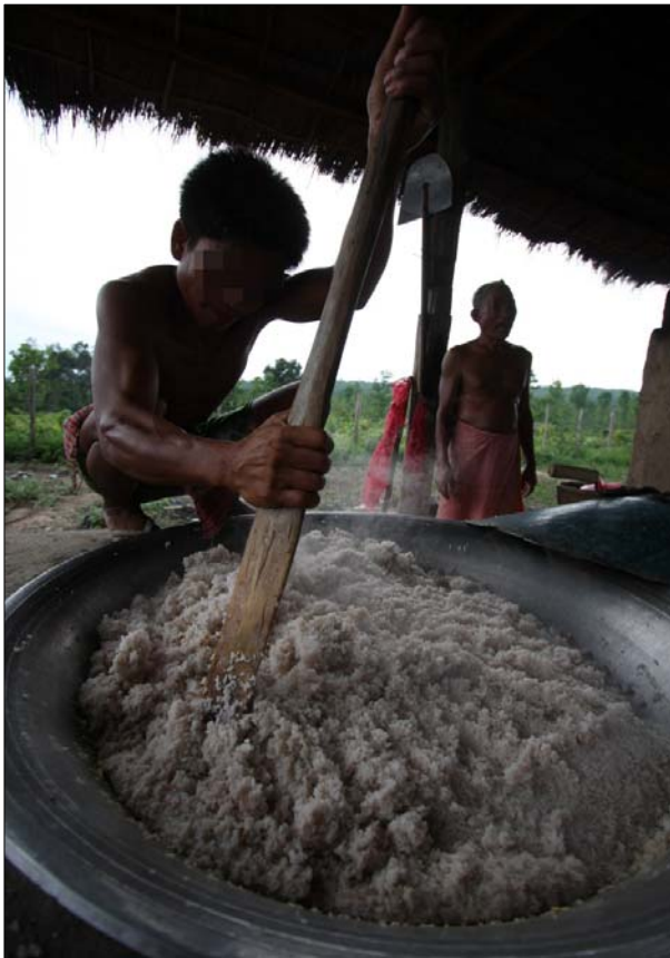
អ្នកទោសរៀបចំអាហារនៅមណ្ឌលអប់រំកែប្រែទី៤៖ បាយគឺជាអាហារគោលក្នុងពន្ធនាគារ បន្លែ និងប្រូតេអ៊ីនគឺមិនគ្រប់គ្រាន់

ផលប៉ះពាល់អវិជ្ជមាននៃភាពចង្អៀតណែនប្រហែលជាមានការដឹងជាទូទៅ ហើយវានៅតែបាននិយាយរំលឹកឡើងវិញ ៧ ៖ ពន្ធនាគារកម្ពុជា ប្រតិបត្តិការជាមួយនឹងធនធានហេដ្ឋារចនាសម្ព័ន្ធ និងថវិកាមានកំរិតទាបណាស់។ របបម្ហូបអាហាររបស់អ្នកទោសខ្វះជាតិប្រូតេអ៊ីន និងវីតាមីនសមស្រប ទឹកដែលអាចបរិភោគបាន មានការផ្តល់អោយមិនគ្រប់គ្រាន់ ការថែទាំសុខភាពស្ទើរតែគ្មានផ្តល់អោយចំពោះអ្នកទោសទាំងឡាយណាដែលមិនអាចបង់ប្រាក់បាន កម្មវិធីអប់រំ និងបណ្តុះបណ្តាលវិជ្ជាជីវៈ ជំនាញដែលមាន គឺក្នុងសភាពមិនបិតថេរ។ កន្លែងរស់នៅក្នុងបន្ទប់ពន្ធនាគារមានទំហំតូចចង្អៀត