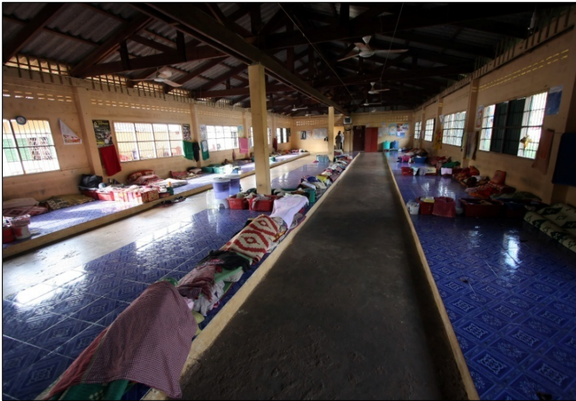
កន្លែងគេងរបស់អ្នកទោសបុរសមជ្ឈមណ្ឌលព្យាបាលសារធាតុញៀន ភ្នំបាក់

អង្គការលីកាដូ បានផ្តល់ អនុសាសន៍ក្នុងរបាយការណ៍ ពីមុនថា ការប្រើជម្រើសផ្សេង អោយបានច្រើន ក្រៅពីការ ដាក់ពន្ធនាគារ មានដូចជា សេវាតាមសហគមន៍ ការបង់ ប្រាក់ធានានៅក្រៅឃុំ និងការ ព្យួរទោស អាចនឹងជួយកាត់ បន្ថយចំនួនអ្នកទោសនៅតាម ពន្ធនាគារ។