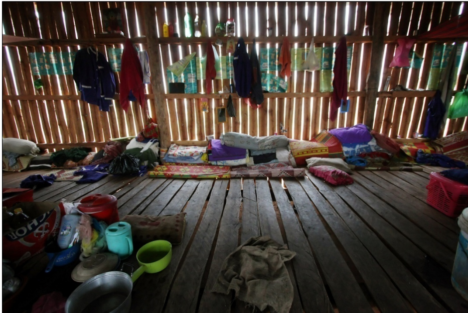
ខាងក្នុងបន្ទប់មណ្ឌលអប់រំកែប្រែទី៤

ទោះបីជាលទ្ធភាពផ្ទុកអ្នកទោសបានរបស់ពន្ធនាគារបានកើនឡើងសន្សឹមៗ ប៉ុន្តែអ្នកទោសក៏បន្តកើនឡើងនូវចំនួនច្រើនឡើងៗផងដែរ។ គិតមកដល់ថ្ងៃទី២៥ ខែមេសា ឆ្នាំ២០១១ ពន្ធនាគារទាំងមូលឃុំឃាំងអ្នកទោសសរុបចំនួន១៥,០០១នាក់ ៤ គឺ១៧៩% នៃលទ្ធភាពផ្ទុកអ្នកទោសបានរបស់ពន្ធនាគារដែលកំរិតត្រឹមបានតែ ៨,៣៦០នាក់ ប៉ុណ្ណោះ។ អ្នកជាប់ឃុំឃាំងជាបណ្តោះអាសន្នមានចំនួនដល់ទៅ៥,៣៩៤នាក់ នៃចំនួនអ្នកជាប់ឃុំឃាំងទាំងអស់ ឬក៏ ៣៦%។