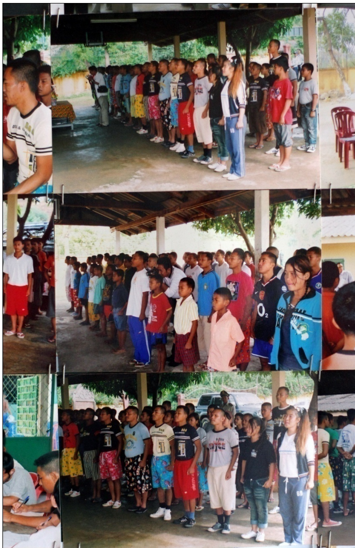
រូបនៅលើជញ្ជាំងមជ្ឈមណ្ឌលព្យាបាលសារធាតុញៀន ភ្នំបាក់បង្ហាញអ្នកជាប់ឃុំឃាំងដែលមានអាយុប្រហែលពី១៥ឆ្នាំឡើងទៅ

ករណីលើកលែងមួយក្រៅពីអ្វីដែលបានរៀបរាប់ខាងលើ គឺការសាកល្បងមួយដែលកំពុងតែប្រព្រឹត្តិទៅនាពេលថ្មីៗនេះ គឺនៅក្នុងខេត្តបន្ទាយមានជ័យ។ ប៉ុន្តែ ប្រហែលមិនមែនជាគំរូមួយសម្រាប់អនុវត្តតាម នៅទូទាំងប្រទេសនោះទេ។ ពាក់ព័ន្ធនឹងការបញ្ជូនអ្នកជាប់ឃុំឃាំងបណ្តោះអាសន្នរងចាំសវនាការ ទៅមជ្ឈមណ្ឌលព្យាបាលសារធាតុញៀនក្នុងមូលដ្ឋានជាទឹកនៃដៃដែលអ្នកទាំងនោះត្រូវបានដាក់ឃុំឃាំងក្រោមផ្លាក “ព្យាបាល”។ ជាធម្មតាមជ្ឈមណ្ឌលព្យាបាលសារធាតុញៀនមិនមានមុខងារជាមណ្ឌលឃុំឃាំងបណ្តោះអាសន្នទេ។