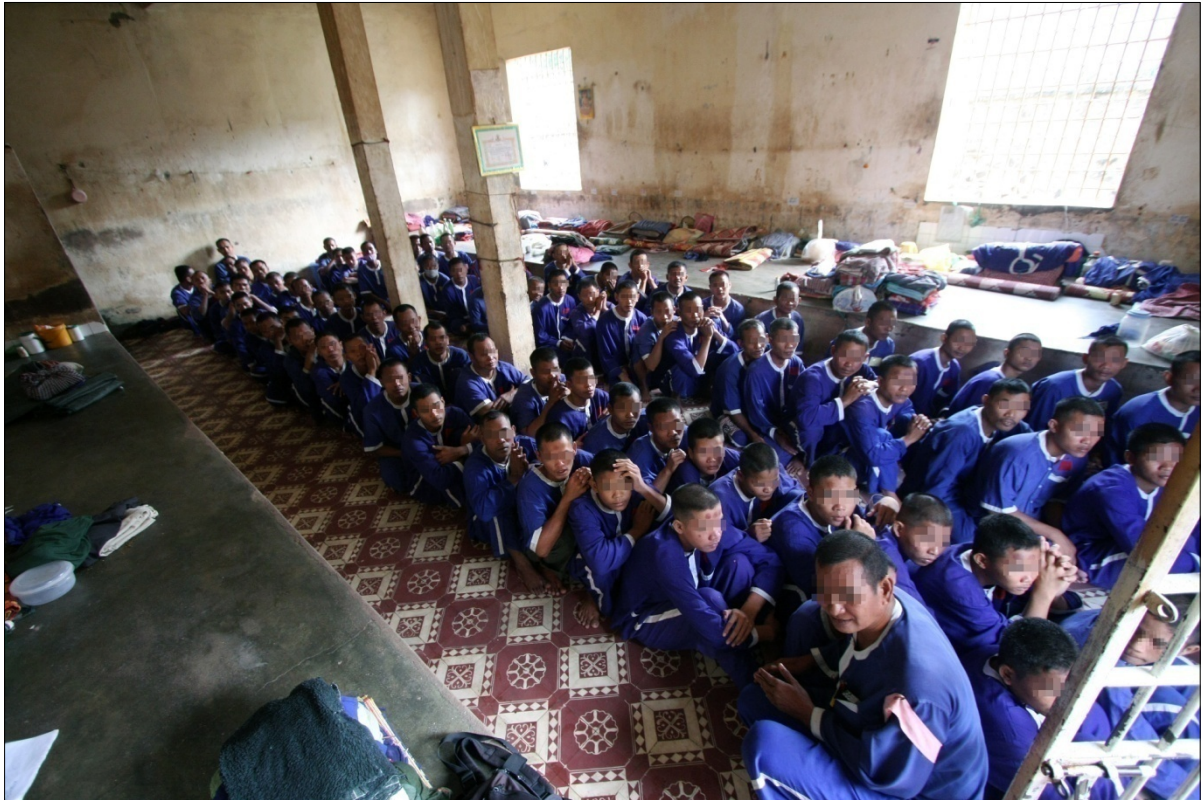
បន្ទប់អ្នកទោសបុរស នៅពន្ធនាគារខេត្តកំពង់ឆ្នាំង

គុណភាពនៃលទ្ធភាពដែលផ្ទុកអ្នកទោសបាននៅពន្ធនាគារខ្លះ ហាក់ដូចជាស្ទើរតែដូច និងស្ថានភាពជាក់ស្តែង។ ឧទាហរណ៍ បន្ទប់ឃុំឃាំងទំហំ ៨៥ម៉ែត្រការ៉េនៅពន្ធនាគារតាខ្មៅ នាពេលថ្មីៗនេះ មានផ្ទុកអ្នកទោសចំនួន ៩៧នាក់ ដែលគិតទៅអ្នកទោសម្នាក់ៗទទួលបានត្រឹមតែទំហំ ០.៨៨ ម៉ែត្រការ៉េប៉ុណ្ណោះ។ បន្ទប់ឃុំឃាំងនេះដែលសមស្របបំផុតគួរតែដាក់អ្នកទោសត្រឹមតែ ២១ ទៅ ៤២នាក់ប៉ុណ្ណោះ ដែលមានន័យថា លទ្ធភាពផ្ទុកឡើងដល់ទៅ៤៦២% ទៅ២៣១% លើលទ្ធភាពដែលផ្ទុកអ្នកទោសបាន។ ប៉ុន្តែលទ្ធភាពផ្ទុក និងអត្រាឃុំឃាំងផ្លូវការណ៍របស់ពន្ធនាគារតាខ្មៅ ឆ្លុះបញ្ចាំងស្ថានភាពពិតនេះ យោងតាមស្ថិតិអង្គការលីកាដូ ពន្ធនាគារទាំងមូលផ្ទុកអ្នកទោសដល់ទៅ ៣៣១% នៃលទ្ធភាពផ្ទុកជាផ្លូវការ។