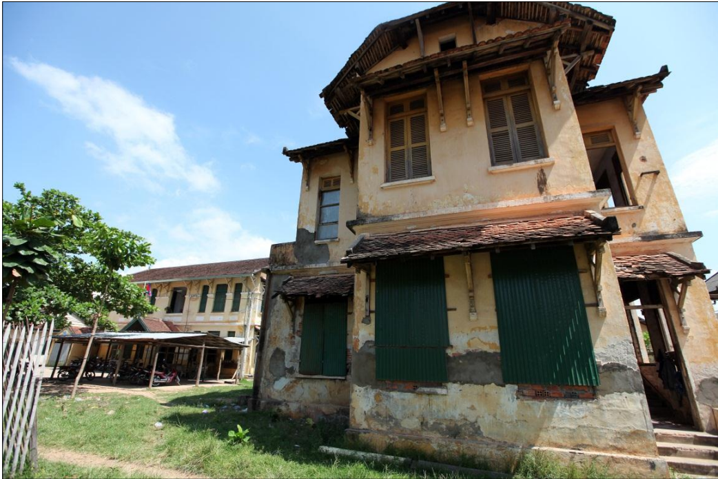
អគារនាសម័យអាណានិគមស្ថិតក្នុងស្ថានភាពចាស់ទ្រុឌទ្រោមនៅក្នុងបរិវេណ នៃពន្ធនាគារខេត្ត កំពត។ ពន្ធនាគារនេះ បានកសាងឡើងនៅក្នុងឆ្នាំ១៩៣៦ ដោយគិតត្រឹមខែឧសភា ឆ្នាំ២០១២ ពន្ធនាគារនេះ មានផ្ទះអ្នកទោសចំនួន ៥៥៥ នាក់ ដែលចំនួននេះលើសពីទំហំ ដែលអាចផ្ទុកបាន ២៨០%។

នៅក្នុងផ្នែកចុងក្រោយនៃរបាយការណ៍នេះ យើងខ្ញុំពិនិត្យឡើងវិញនូវអនុសាសន៍ សំខាន់ៗទាំងឡាយ ដែលបានធ្វើនៅក្នុងរបាយការណ៍របស់យើងក្នុងឆ្នាំ២០១០ និងឆ្នាំ ២០១១ ហើយនឹងតាមដានមើលភាពរីកចំរើន ដែលបានធ្វើឡើងឆ្ពោះទៅរកការបំពេញ បាននូវអនុសាសន៍ទាំងនេះ។