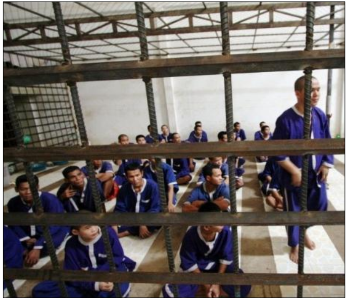
អ្នកទោសជាបុរសអង្គុយនៅក្នុងរោងដែកនៃពន្ធនាគារខេត្តប៉ៃលិន។ ពន្ធនាគារនេះ ជាអតីតរោងភាពយន្ត ហើយបានចាប់ដំណើរការកាលពីឆ្នាំ២០១១ ក្នុងនាមជាពន្ធនាគារបណ្តោះអាសន្ន ប៉ុន្តែការសាងសង់ពន្ធនាគារពិតប្រាកដនៅមិនទាន់ចាប់ផ្តើមនៅឡើយ។

គម្រោងទាំងនេះ ភាគច្រើនទំនងជាត្រូវប្រើពេលរាប់ឆ្នាំ ដើម្បីបញ្ចប់ការងារសាងសង់។ ពិតហើយនៅតែមិនទាន់បានកំណត់កាលបរិច្ឆេទបញ្ចប់ការងារសាងសង់សម្រាប់ពន្ធនាគារថ្មីនៅខេត្តប៉ៃលិន ដែលជាពន្ធនាគារត្រូវការជាបន្ទាន់ ដោយសារបច្ចុប្បន្នជនជាប់ឃុំរស់នៅក្នុងរោងភាពយន្តមួយចាស់ទ្រុឌទ្រោម។ លក្ខខណ្ឌឃុំខ្លួនមានសភាពធ្ងន់ធ្ងរជាងគេបំផុតក្នុងចំណោមពន្ធនាគារទាំងអស់នៅកម្ពុជា - គ្មានទីធ្លាចំហសម្រាប់ជនជាប់ឃុំចេញមកទទួលខ្យល់អាកាស ឬពន្លឺថ្ងៃឡើយ ហើយជនជាប់ឃុំជាបុរសត្រូវបានឃុំខ្លួនក្នុងទ្រុងមួយ។ អគារនេះមិនសមនឹងយកមកធ្វើជាពន្ធនាគារសម្រាប់ដាក់មនុស្សទេ។ បច្ចុប្បន្ន