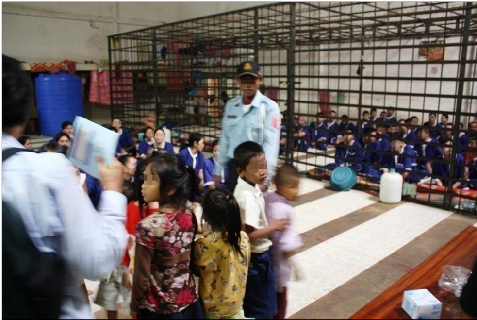
ម្តាយ និងកូនដែលជាប់ឃុំក្នុងពន្ធនាគារខេត្តប៉ៃលិន។ អ្នកទោសជាបុរសចំណាយពេលភាគច្រើននៅក្នុងរនាំងដែក ដែលអាចមើលឃើញក្នុងរូបភាព

ជាពិសេសការចាប់ខ្លួនអ្នកប្រើប្រាស់សារធាតុញៀន គឺជាយុទ្ធសាស្ត្រប្រព័ន្ធយុត្តិធម៌ ព្រហ្មទណ្ឌមួយដែលមានបញ្ហា។ អ្នកជំនាញយល់ព្រមយ៉ាងទូលំទូលាយថា អ្នក