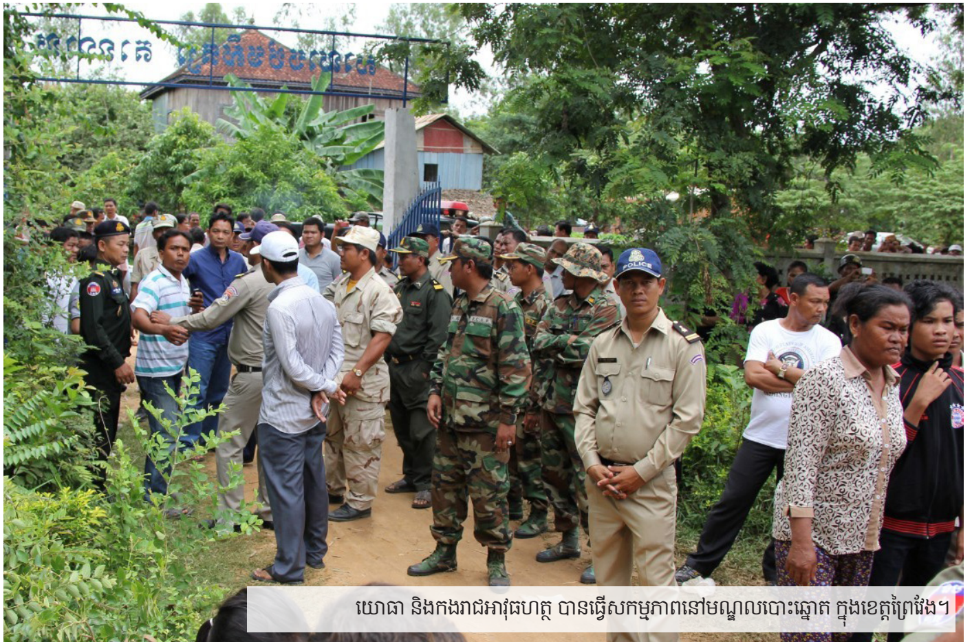
យោធា និងកងរាជអាវុធសព្វ បានធ្វើសកម្មភាពនៅមណ្ឌលបោះឆ្នោត ក្នុងខេត្តព្រៃវែង។