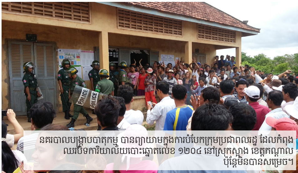
នគរបាលបង្កាប់បាត់កម្ម បានព្យាយាមក្នុងការបំបែកក្រុមប្រជាពលរដ្ឋ ដែលកំពុង ឈររិះទឹកការិយាល័យបោះឆ្នោតលេខ ១២០៤ នៅស្រុកស្អាង ខេត្តកណ្តាល ប៉ុន្តែមិនបានសម្រេច។

បន្ទាប់ពីមានការបិទទ្វារដោយក្រុមប្រជាពលរដ្ឋអស់រយៈពេលពីរបីម៉ោង ការប្រមូលផ្តុំ របស់ប្រជាពលរដ្ឋកាន់តែបន្តកើនច្រើនឡើង ពេលនោះក៏មានកម្លាំងនគរបាលអន្តរាគមន៍ ប្រហែល ១៥នាក់ ប្រដាប់ដោយខែលការពារ និងដំបងឆក់ បានមកដល់។ បន្ទាប់មក មន្ត្រីឃុំម្នាក់ បាននិយាយយ៉ាងយូរដោយប្រើ ឧបាយសន្តិវិធី (មេត្រូ) ដើម្បីព្យាយាមឲ្យក្រុម ប្រជាពលរដ្ឋចាកចេញពីការិយាល័យបោះឆ្នោត ប៉ុន្តែពុំបានសម្រេចលទ្ធផលទេ។ មន្ត្រីក៏បាន និយាយផងដែរថា ប្រសិនបើក្រុមមហាជនចាកចេញ ហើយអនុញ្ញាតឲ្យអ្នកមកពីឆ្ងាយបោះឆ្នោត នោះបុរសម្នាក់ដែល ត្រូវបានចាប់ខ្លួននោះ នឹងត្រូវដោះរំលងភ្លាម។ ចំនួនក្រុមមហាជន បានកើនឡើងរាប់រយនាក់ ឈរពាសពេញចំពីមុខទ្វារ។ ដើម្បីបន្តការតវ៉ា តទៅទៀត ក្រុមមហាជនបានធ្វើការប្រមូលថវិកា ក្នុងចំណោមមហាជននានា ដើម្បីទិញអាហារ និង ទឹក ដើម្បីលើកទឹកចិត្តប្រជាពលរដ្ឋទាំងនោះ ឲ្យបន្តឈររិះទ្វារតទៅទៀត។