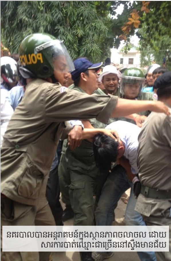
នគរបាលបានអន្តរាគមន៍ក្នុងស្ថានភាពចលាចល ដោយសារការបាត់ឈ្មោះជាច្រើននៅស្ទឹងមានជ័យ

ព្រឹត្តិការណ៍ទាំងនេះ ត្រូវបានរាយការណ៍ដោយសារព័ត៌មានយ៉ាងច្រើន។ របាយការណ៍សង្ខេប លីកាដូ