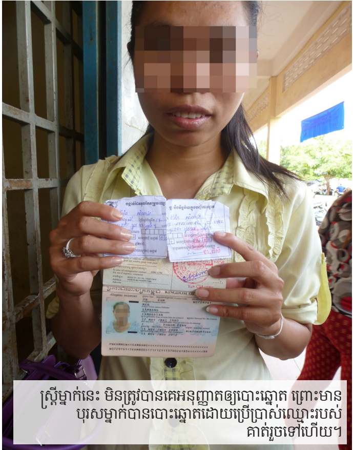
ស្ត្រីម្នាក់នេះ មិនត្រូវបានគេអនុញ្ញាតឱ្យបោះឆ្នោត ព្រោះមានបុរសម្នាក់បានបោះឆ្នោតដោយប្រើប្រាស់ឈ្មោះរបស់គាត់រួចទៅហើយ។

ស្ត្រីម្នាក់ទៀតក៏មានលិខិតឆ្លងដែនដែរ ហើយក៏ឃើញមាន