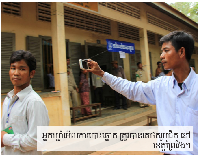
អ្នកឃ្នាំមើលការបោះឆ្នោត ត្រូវបានថតរូបជិត នៅ ខេត្តព្រៃវែង។

ពេលទៅដល់ បុគ្គលិកលីកាដូ បានឃើញ មនុស្ស៤នាក់ ឈរ ក្នុងជួរដែលមានគ្នា ១០នាក់ កាន់ទម្រង់បែបនេះចូលទៅបោះឆ្នោត។ អាជ្ញាធរដែនដី មានការភិតភ័យដោយឃើញមានវត្តមានអ្នកសង្កេត- ការណ៍ នៅក្នុងបរិវេណវត្ត ហើយភ្លាមនោះក៏បាននិយាយគ្នាតាមវិទ្យុ ទាក់ទង។ អ្នកភូមិបានឱ្យប្រាប់អ្នកសង្កេតការណ៍លីកាដូ ថាឲ្យនៅ ក្នុងវត្តនេះសិនហើយ ដើម្បីចៀសវាងកុំឲ្យមានអ្នកចម្លែកចូលមកបោះ ឆ្នោត ដោយប្រើប្រាស់ទម្រង់លិខិតបញ្ជាក់អត្តសញ្ញាណបែបនេះ។ ប៉ុន្តែ អ្នកសង្កេតការណ៍លីកាដូ បានចាកចេញ ទៅសង្កេតការណ៍នៅ ការិយាល័យផ្សេងទៀត (ក្រុមចល័ត)។