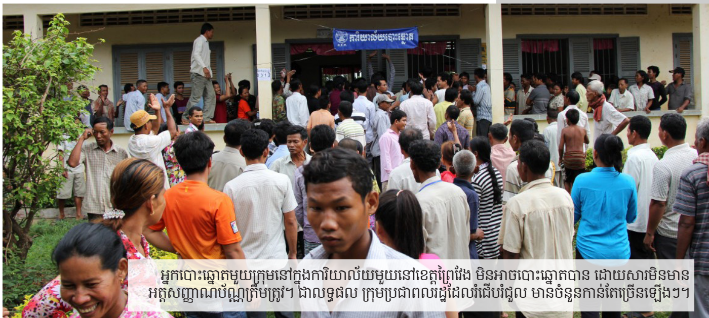
អ្នកបោះឆ្នោតមួយក្រុមនៅក្នុងការិយាល័យមួយនៅខេត្តព្រៃវែង មិនអាចបោះឆ្នោតបាន ដោយសារមិនមាន អត្តសញ្ញាណប័ណ្ណត្រឹមត្រូវ។ ដាលទួល ក្រុមប្រជាពលរដ្ឋដែលរំដើបរំជួល មានចំនួនកាន់តែច្រើនឡើងៗ។

នៅមណ្ឌលបោះឆ្នោតសាលាបឋមសិក្សា ហ៊ុនសែន មិត្តភាព អ្នកសង្កេតការណ៍ បានឃើញមានប្រជាពលរដ្ឋចំនួន ៥នាក់ ដែលមិនអាចបោះឆ្នោតបាន ព្រោះឈ្មោះ របស់អ្នកទាំងនោះមិនមាននៅក្នុងបញ្ជី ឈ្មោះបោះឆ្នោតដោយមិននឹកស្មានដល់។ នៅក្នុង ការិយាល័យបោះឆ្នោតលេខ ០១៨៧ និង ០០៧៤ ក្នុងសង្កាត់ អ្នកសង្កេតការណ៍ បាននិយាយជាមួយ បុរសម្នាក់ ដែលបានបង្ហាញពួកគេ នូវប័ណ្ណព័ត៌មានបោះឆ្នោត ចំនួនពីរ នៅក្នុងការិយាល័យពីរផ្សេងគ្នា ដែលអាច ធ្វើឱ្យបុរសម្នាក់នោះ អាចបោះ ឆ្នោតបាន ពីរដង។ នៅការិយាល័យលេខ ០០៣៦ ក្នុងសង្កាត់លេខ៤អ្នកសង្កេតការណ៍ បាន និយាយជាមួយស្ត្រីម្នាក់ដែលមិនអាចបោះ ឆ្នោតបាន ទោះបីជាស្ត្រីនោះមានគ្រប់ឯក សារត្រឹមត្រូវក៏ដោយ ព្រោះមានមនុស្ស ម្នាក់ត្រូវបានសន្មតថា បានបោះជំនួសនាង រួចទៅហើយ។