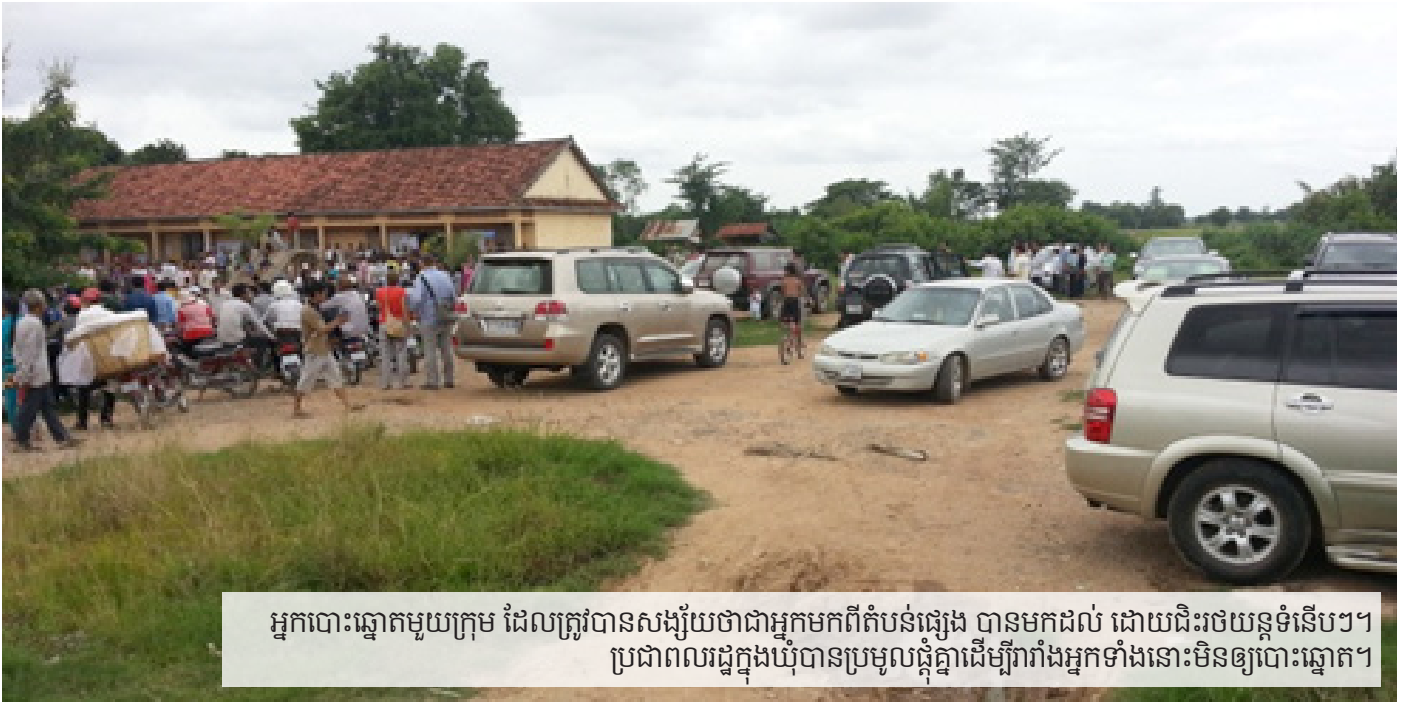
អ្នកបោះឆ្នោតមួយក្រុម ដែលត្រូវបានសង្ឃឹមថាជាអ្នកមកពីតំបន់ផ្សេង បានមកដល់ ដោយជិះរថយន្តទំនើបៗ។ ប្រជាពលរដ្ឋក្នុងឃុំបានប្រមូលផ្តុំគ្នាដើម្បីរារាំងអ្នកទាំងនោះមិនឲ្យបោះឆ្នោត។

នៅក្នុងស្ថានភាពជាច្រើន អ្នកសង្កេតការណ៍លីកាដូ បានសង្កេតឃើញថា មានពលរដ្ឋមួយក្រុមធំ បានមកដល់ភ្លាមៗ ដើម្បីបោះឆ្នោតនៅក្នុងឃុំ ជាកន្លែងដែលអ្នកទាំងនោះបានទទួលស្គាល់ថាខ្លួនពុំមានសិទ្ធិបោះឆ្នោតឡើយ។ អ្នកទាំងនោះបានធ្វើដំណើរមកដល់តាមក្បួនរថយន្តទំនើបៗ។ តាមពិតគឺ ប្រជាពលរដ្ឋទាំងនោះសុទ្ធតែមានឈ្មោះនៅក្នុងបញ្ជីបោះឆ្នោត ហើយមួយចំនួនធំ គឺនៅតាមមណ្ឌលដែលទើបតែបង្កើតឡើងថ្មីៗ ទោះបីជាពលរដ្ឋទាំងនោះ បានទទួលស្គាល់ថា ពួកគេពុំមែនជាអ្នកភូមិដែលរស់នៅក្នុងឃុំនោះក៏ដោយ។ ដែលរឿងនេះ បានបណ្តាលឲ្យមានការសង្ឃឹមចោទប្រកាន់ថា មានចេតនាក្នុងការចុះឈ្មោះបន្ត។ បញ្ហានេះ ត្រូវតែមានការស៊ើបអង្កេតដោយឯករាជ្យ និងស្មោះត្រង់ច្បាស់លាស់។