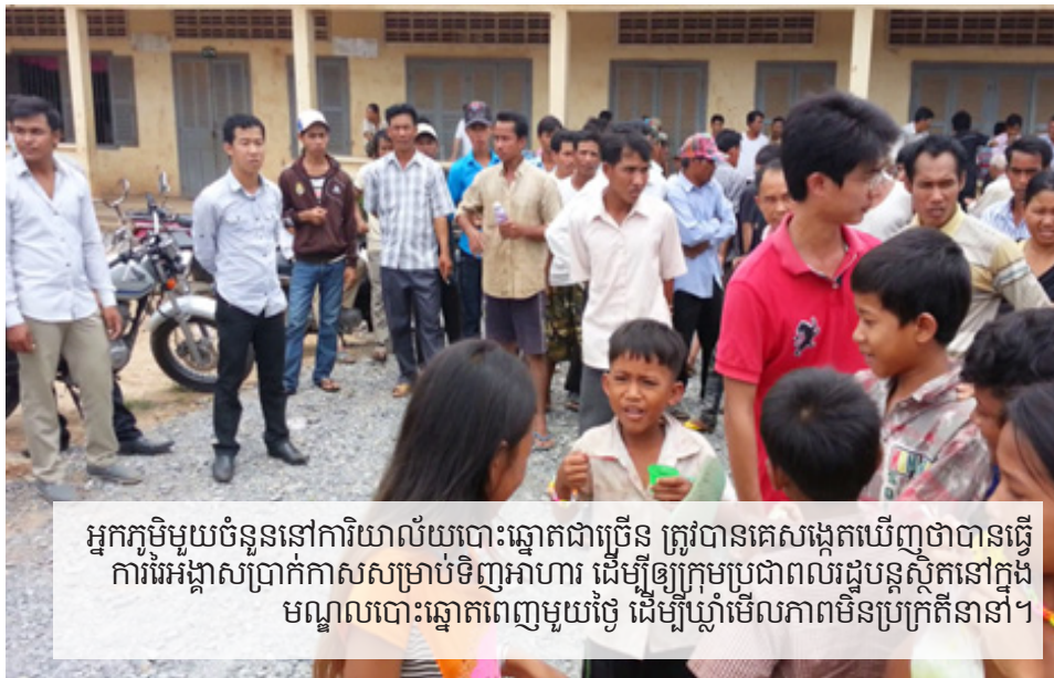
អ្នកភូមិមួយចំនួននៅការិយាល័យបោះឆ្នោតជាច្រើន ត្រូវបានគេសង្កេតឃើញថាបានធ្វើ ការអង្កេតប្រាក់កាសសម្រាប់ទិញអាហារ ដើម្បីឲ្យក្រុមប្រជាពលរដ្ឋបន្តស្ថិតនៅក្នុង មណ្ឌលបោះឆ្នោតពេញមួយថ្ងៃ ដើម្បីឃ្នាំមើលភាពមិនប្រក្រតីនានា។

អ្នកសង្កេតការណ៍អង្គការ លីកាដូ មិនបានឃើញហេតុការណ៍នោះពីដំបូងឡើយ ប៉ុន្តែអ្នក ឃ្នាំមើលមួយចំនួន បានឃើញកងរាជអាវុធបាតុ និងនគរបាលជាច្រើន បានឈរនៅខាងក្រោយ ច្រកចេញចូលសាលារៀន ហើយបានបញ្ជាក់អំពីព្រឹត្តិការណ៍នោះជាមួយអ្នកសង្កេតការណ៍ដទៃ ទៀត។