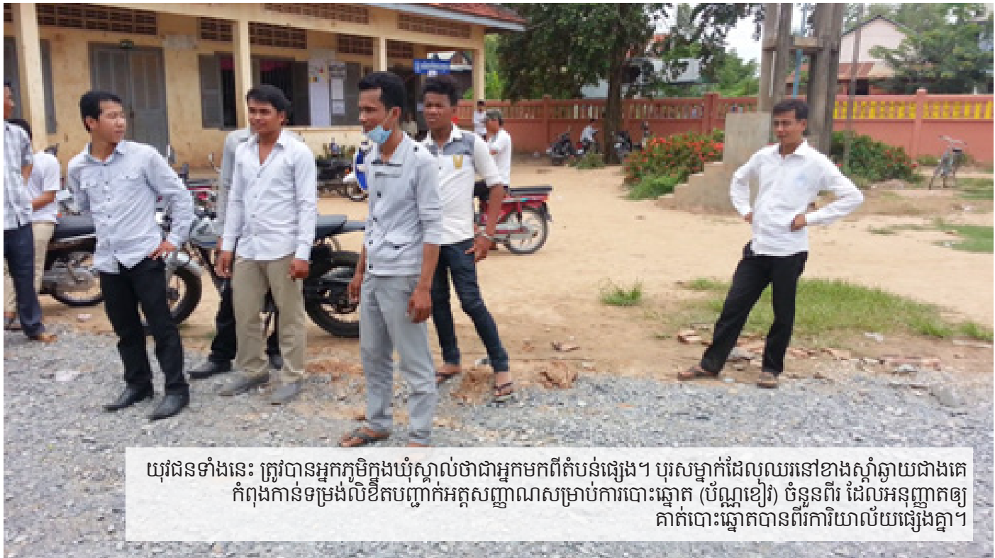
យុវជនទាំងនេះ ត្រូវបានអ្នកភូមិក្នុងឃុំស្គាល់ថាជាអ្នកមកពីតំបន់ផ្សេងៗ។ បុរសម្នាក់ដែលឈរនៅខាងស្តាំឆ្ងាយជាងគេ កំពុងកាន់ទម្រង់លិខិតបញ្ជាក់អត្តសញ្ញាណសម្រាប់ការបោះឆ្នោត (ប័ណ្ណខៀវ) ចំនួនពីរ ដែលអនុញ្ញាតឲ្យ គាត់បោះឆ្នោតបានពីការិយាល័យផ្សេងគ្នា។

ឃុំព្រែកគយ ក្នុងពេលចុះឈ្មោះបោះឆ្នោត គឺជាតំបន់មួយដែល មានបញ្ហាច្រើន ក្នុងចំណោមតំបន់នានាក្នុងខេត្តកណ្តាល ដោយមាន អត្រាចុះឈ្មោះ រហូតដល់ ១៣៩.៦៣ភាគរយ។ ការចុះទៅស៊ើបអង្កេត ដោយអ្នកឃ្នាំមើលសិទ្ធិមនុស្ស លីកាដូ មុនបោះឆ្នោត១ថ្ងៃ បញ្ជាក់ឲ្យ ឃើញថា បញ្ហាការចុះឈ្មោះច្រើនហួសប្រមាណនេះ សមាជិកក្រុម ប្រឹក្សាឃុំមកពីគណបក្ស សម រង្ស៊ី និង សិទ្ធិមនុស្ស មានការព្រួយបារម្ភ យ៉ាងខ្លាំងអំពីបញ្ហាកើនចំនួនអ្នកបោះឆ្នោតនេះ ធៀបទៅនឹងចំនួនអ្នក ភូមិ ដែលរស់នៅ នៅក្នុងឃុំនេះ។