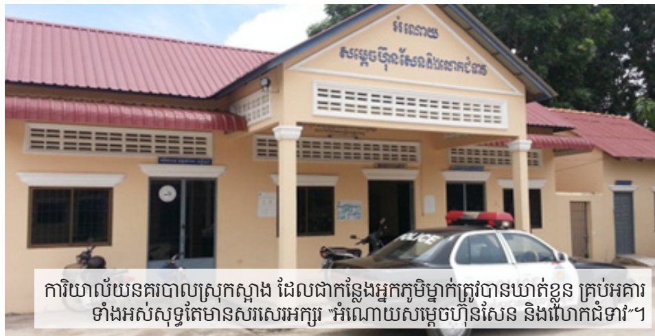
ការិយាល័យនគរបាលស្រុកស្អាង ដែលជាកន្លែងអ្នកភូមិម្នាក់ត្រូវបានឃាត់ខ្លួន គ្រប់អគារ ទាំងអស់សុទ្ធតែមានសរសេរអក្សរ “អំណោយសម្តេចហ៊ុនសែន និងហែកជំទាវ”។

នេះ ទោះបីជាអ្នកទាំងនោះចង់បោះក៏ដោយ ដោយសារអ្នកទាំងនោះត្រូវបានគេរារាំងក្នុងការធ្វើ ដំណើរទៅកាន់មណ្ឌលបោះឆ្នោត ដែលអ្នកទាំងនោះបានចុះឈ្មោះដោយស្របច្បាប់។ ជាថ្មីម្តង ទៀត ភាគរយខ្ពស់នៃឈ្មោះអ្នកបោះឆ្នោតស្ទុះនៅក្នុងឃុំនេះ ក៏ជាអំណះអំណាងបន្ថែមដល់ការ សង្កេតការណ៍ទាំងនេះផងដែរ។