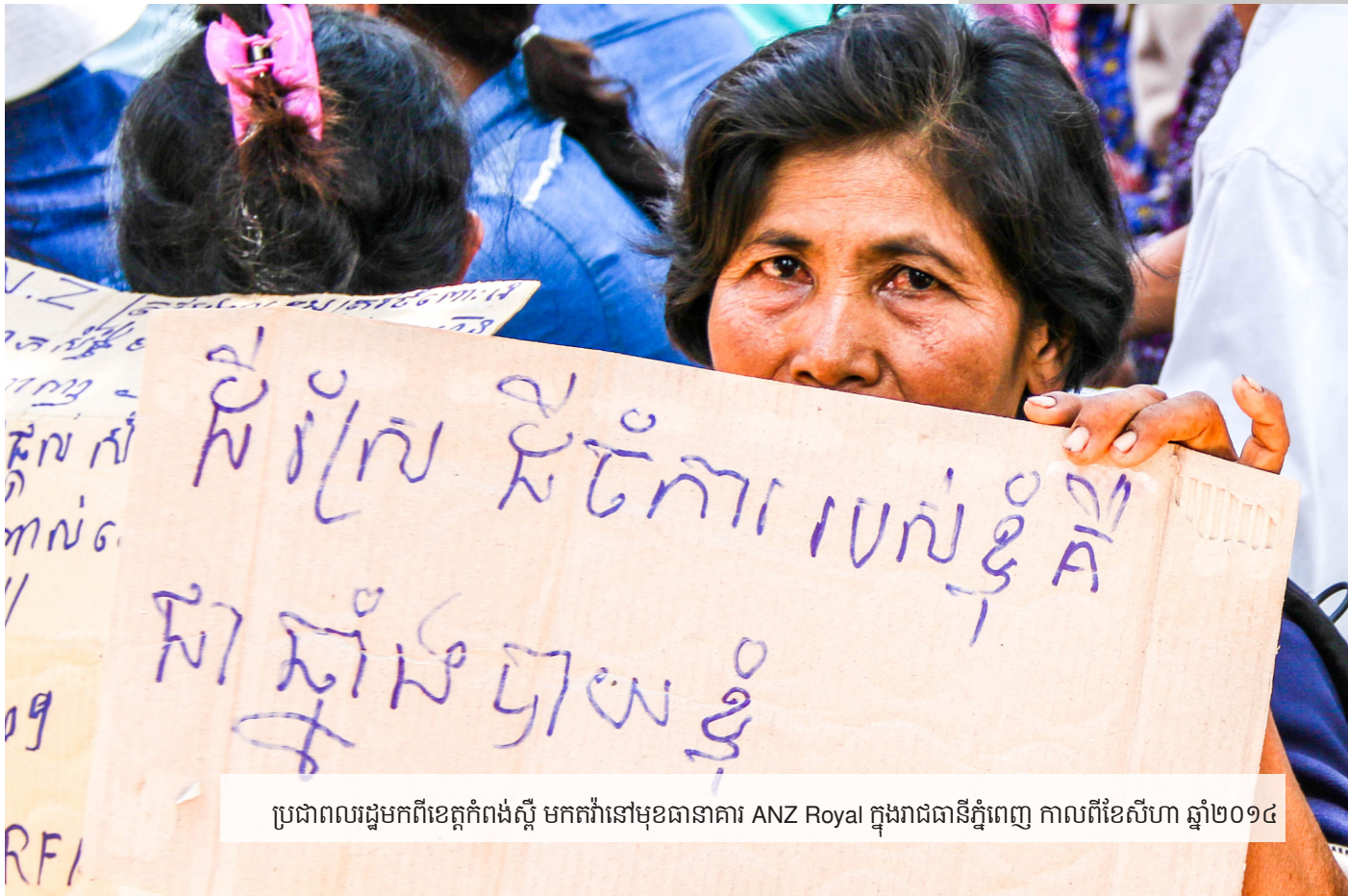
ប្រជាពលរដ្ឋមកពីខេត្តកំពង់ស្ពឺ មកតវ៉ានៅមុខធានាគារ ANZ Royal ក្នុងរាជធានីភ្នំពេញ កាលពីខែសីហា ឆ្នាំ២០១៤