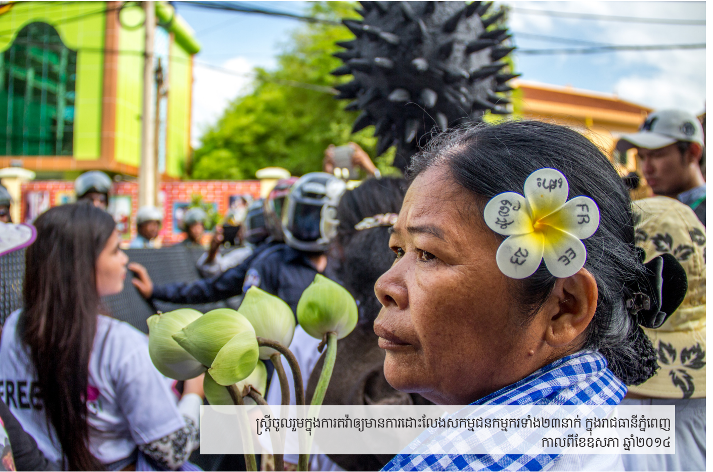
ស្ត្រីចូលរួមក្នុងការតវ៉ាឲ្យមានការដោះលែងសកម្មជនកម្មករទាំង២៣នាក់ ក្នុងរាជធានីភ្នំពេញ កាលពីខែឧសភា ឆ្នាំ២០១៤