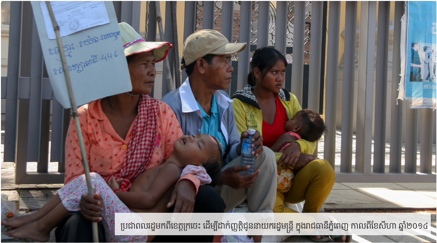
ប្រជាពលរដ្ឋមកពីខេត្តក្រចេះ ដើម្បីដាក់ពាក្យជូននាយករដ្ឋមន្ត្រី ក្នុងរាជធានីភ្នំពេញ កាលពីខែសីហា ឆ្នាំ២០១៤

ស្ត្រីមួយចំនួនបានបង្ហាញថា ស្វាមីរបស់គាត់ក៏បានបញ្ចេញកំហឹងផងដែរចំពោះការអន់ចិត្តផ្នែកផ្លូវភេទ។ ជាការពិតស្ត្រីទាំងនេះ តែងតែចេញពីផ្ទះរហូតដល់យប់ជ្រៅ និងត្រលប់មកវិញអស់កម្លាំង មានន័យថាពួកគាត់មិនមានអារម្មណ៍ផ្លូវភេទសំរាប់ស្វាមីរបស់គាត់ ដូចដែរគាត់ធ្លាប់មានពីមុនមក។ នេះបានធ្វើអោយមានភាពតានតឹង នៅក្នុងទំនាក់ទំនងរបស់ស្ត្រីជាច្រើននាក់ដែលត្រូវបានសម្ភាសន៍ ហើយស្ត្រី ៣ ឬ ៤ នាក់ បាននិយាយថា ប្តីពួកគាត់មិនត្រឹមតែបង្ហាញភាពអាក្រក់អន់ចិត្តចំពោះរឿងនេះទេ ប៉ុន្តែបែបជាចោទប្រកាន់គាត់ថាមានមិត្តប្រុស និងចោទថាអ្នកទាំងនោះថាមិននិយាយការពិតអំពីរឿងចេញពីផ្ទះទៅធ្វើយុទ្ធនាការ។