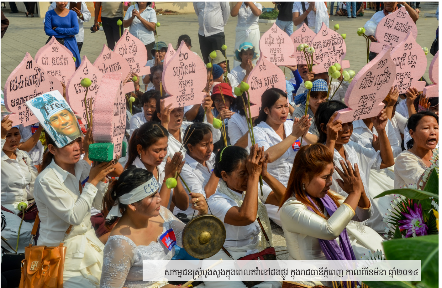
សកម្មជនស្ត្រីប្លង់ស្នងក្នុងពេលតវ៉ានៅជងផ្លូវ ក្នុងរាជធានីភ្នំពេញ កាលពីខែមីនា ឆ្នាំ២០១៤