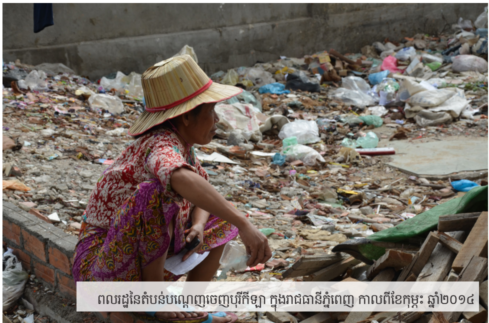
ពលរដ្ឋនៃតំបន់បណ្តេញចេញប្រឹក្សា ក្នុងរាជធានីភ្នំពេញ កាលពីខែកុម្ភៈ ឆ្នាំ២០១៤

ស្ត្រីទាំងអស់បាននិយាយថា ឥទ្ធិពលនៃការបាត់បង់ប្រាក់ចំណូលទៅលើកូនរបស់អ្នកទាំងនោះ ជាពិសេសនៅពេលដែលអ្នកទាំងនោះមិនអាចទ្រទ្រង់ការបង់ថ្លៃសាលារៀនកូនរបស់ពួកគេបាន ហើយក្នុងករណីមិនមានលទ្ធភាពទិញថ្នាំសំខាន់ៗបាន។ ឥទ្ធិពលនេះ ជាប្រភពនៃជម្លោះផ្ទៃខាងក្នុងសម្រាប់ស្ត្រីទាំងអស់ ដោយសារមូលហេតុចំបងរបស់អ្នកទាំងនោះក្នុងការចាប់តួនាទីជាអ្នកធ្វើយុទ្ធនាការ គឺដើម្បីផ្តល់នូវជីវិតដ៏ល្អមួយសម្រាប់កូនរបស់អ្នកទាំងនោះ ដោយធានាថាពួកគេមានផ្ទះសំបែងនាពេលឥឡូវ និងពេលអនាគត។ ពួកគេទាំងអស់ទទួលស្គាល់ថាដោយសារលទ្ធផលនៃជម្រើសនេះ ពួកគេត្រូវលះបង់ទំហំជាក់លាក់មួយនៃការថែរក្សា និងអប់រំកូនរបស់ពួកគេ។ ដូចនេះអ្នកទាំងនោះមានអារម្មណ៍ថាទោះជាពួកគេមានគោលបំណងល្អយ៉ាងណាក៏សកម្មភាពរបស់អ្នកទាំងនោះបានប៉ះពាល់ដល់អនាគតរបស់កូនៗអ្នកទាំងនោះដដែល។