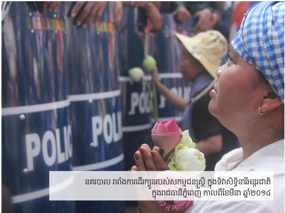
នគរបាល រារាំងការដើរក្បួនរបស់សកម្មជនស្ត្រី ក្នុងទិវាសិទ្ធិនារីអន្តរជាតិ ក្នុងរាជធានីភ្នំពេញ កាលពីខែមីនា ឆ្នាំ២០១៤

នៅតំបន់ទីក្រុង ស្ត្រីទាំងអស់បាននិយាយថាការស្វែងរកជំនួយពីអាជ្ញាធរប្រភេទណាក៏ ដោយដូចជានគរបាលជាដើម គឺមានការពិបាកណាស់សំរាប់ពួកគាត់ដោយសារតែមូលហេតុមួយ ចំនួន។ ជាដំបូងបង្អស់ ដោយសារតែពួកគាត់ជាសកម្មជនដីធ្លី អាជ្ញាធរចាត់ទុកពួកគាត់ថាជាអ្នក បង្កបញ្ហា ហើយដូច្នោះអាជ្ញាធរមិនទំនងជាធ្វើអ្វីមួយដើម្បីជួយពួកគាត់នោះទេ។ សកម្មជនទាំង ឡាយដែលមានកេរ្តិ៍ឈ្មោះល្អ បាននិយាយថាពួកគាត់ភ័យខ្លាចថាប្រសិនបើអាជ្ញាធរបានដឹងអំពី អំពើហិង្សាក្នុងគ្រួសាររបស់ពួកគាត់ អាជ្ញាធរនឹងមិនត្រឹមតែមិនព្រមជួយពួកគាត់ទេ ប៉ុន្តែពួកគេអាច នឹងប្រើព័ត៌មាននេះដើម្បីបង្ខូចកិត្តិយសរបស់ពួកគាត់ទៀតផង។ ស្ត្រីម្នាក់ក្នុងចំណោមនោះបាន និយាយថានគរបាលមូលដ្ឋានរបស់គាត់ជាញឹកញាប់តែងតែតាមដានគាត់ និងត្រួតពិនិត្យរាល់អ្វីៗ