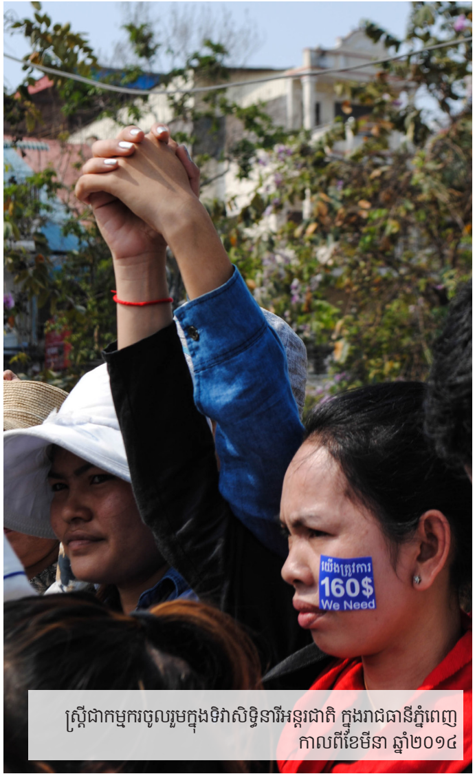
ស្ត្រីជាកម្មករចូលរួមក្នុងទិវាសិទ្ធិនារីអន្តរជាតិ ក្នុងរាជធានីភ្នំពេញ កាលពីខែមីនា ឆ្នាំ២០១៤

ក៏មានភាពខុសប្លែកគ្នាដែរ ហើយវាមានឥទ្ធិពលទៅលើរបៀបដែល ជម្លោះដីធ្លីប៉ះពាល់ទៅលើអ្នកទាំងនោះ។ អ្នកដែលរស់នៅក្នុង សហគមន៍ទីក្រុងជាទូទៅមានស្ថានភាពល្អជាង មានការអប់រំច្រើន ជាង និងមិនមានភាពឯកោច្រើនដូចអ្នកដែលរស់នៅក្នុងសហគមន៍ ជនបទនោះទេ។ ភាគច្រើននៃអ្នកដែលត្រូវបានសម្ភាសន៍ ដែលរស់ នៅតំបន់ជនបទ គឺកំពុងតែរស់នៅក្នុងស្ថានភាពលំបាកធ្ងន់ធ្ងរទៅ ហើយ មុនពេលដែលជម្លោះដីធ្លីរបស់ពួកគាត់កើតឡើង។ អ្នកទាំង នោះមិនត្រឹមតែក្រីក្រនោះ ប៉ុន្តែជានិច្ចជាកាលតែងតែទទួលរងផលប៉ះ ពាល់ដោយសារពិការភាព ការញៀនស្រា និងអំពើហិង្សាក្នុងគ្រួសារ ដែលមានពីមុនមកទៅហើយ។ ការរកឃើញខាងក្រោមនឹងព្យាយាម ឆ្លុះបញ្ចាំងអំពីភាពខុសប្លែកទាំងនេះខ្លះៗ ហើយទន្ទឹមនឹងនេះក៏ ព្យាយាមទាញសេចក្តីសន្និដ្ឋាន អំពីភាពដូចគ្នារវាងបទពិសោធន៍ របស់ស្ត្រីដែលទទួលការសម្ភាសន៍ទាំងអស់។