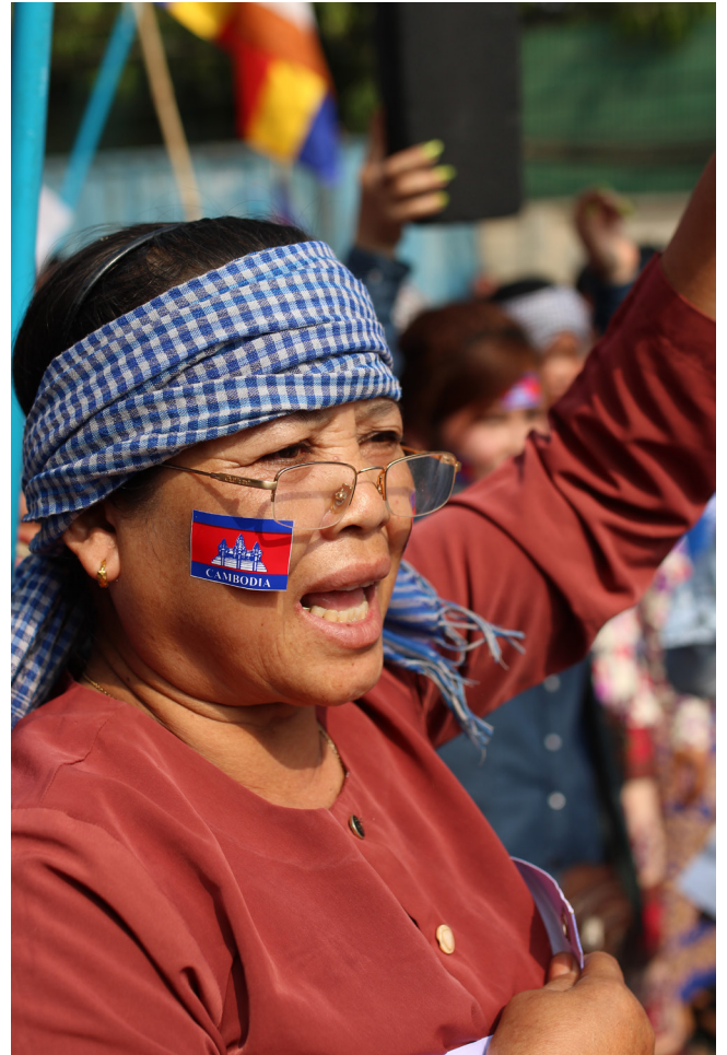
គំរូបមុខ៖ សកម្មជនស្ត្រីចូលរួមការទាមទារក្នុងទិវាសិទ្ធិនារីអន្តរជាតិ ក្នុងរាជធានីភ្នំពេញ កាលពីខែមីនា ឆ្នាំ២០១៤