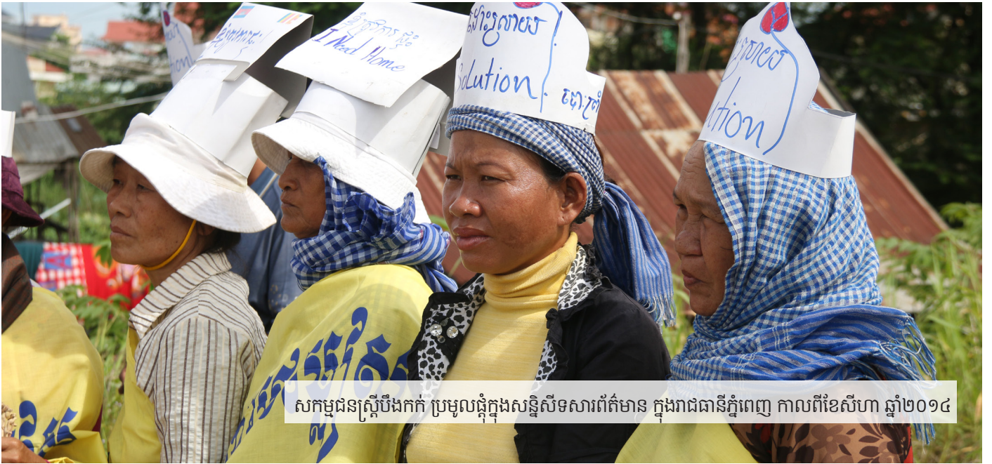
សកម្មជនស្ត្រីបឹងកក់ ប្រមូលផ្តុំក្នុងសន្និសីទសារព័ត៌មាន ក្នុងរាជធានីភ្នំពេញ កាលពីខែសីហា ឆ្នាំ២០១៤