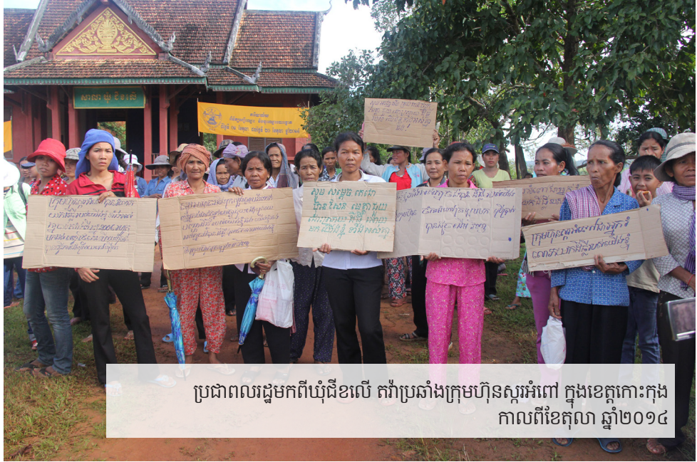
ប្រជាពលរដ្ឋមកពីឃុំជីខលើ តវ៉ាប្រឆាំងក្រុមហ៊ុនស្តារអំពៅ ក្នុងខេត្តកោះកុង កាលពីខែតុលា ឆ្នាំ២០១៤

នៅក្នុងសហគមន៍មួយ អ្នកដឹកនាំជាច្រើននាក់បានទទួលជោគជ័យក្នុងការទាមទារប្លង់កម្មសិទ្ធិដីធ្លី ប៉ុន្តែអ្នកទាំងនោះបានសម្រេចចិត្តបន្តធ្វើយុទ្ធនាការរហូតដល់មនុស្សគ្រប់គ្នានៅក្នុងសហគមន៍ទទួលបានប្លង់កម្មសិទ្ធិដីដែរ។ ដោយសារតែមូលហេតុនេះស្វាមីរបស់អ្នកទាំងនោះនឹងសមាជិកគ្រួសារដទៃទៀតបានចោទប្រកាន់ថាពួកគាត់កំពុងតែពេញចិត្ត ទៅនិងការចាប់អារម្មណ៍ និងកេរ្តិ៍ឈ្មោះដែលជាលទ្ធផលបានមកពីភាពសកម្មនិយមរបស់ពួកគាត់ ហើយបានចោទប្រកាន់ថាពួកគាត់បានទុកចោលគ្រួសារដើម្បីបន្តទទួលបានប្រជាប្រិយភាពទាំងនេះ។