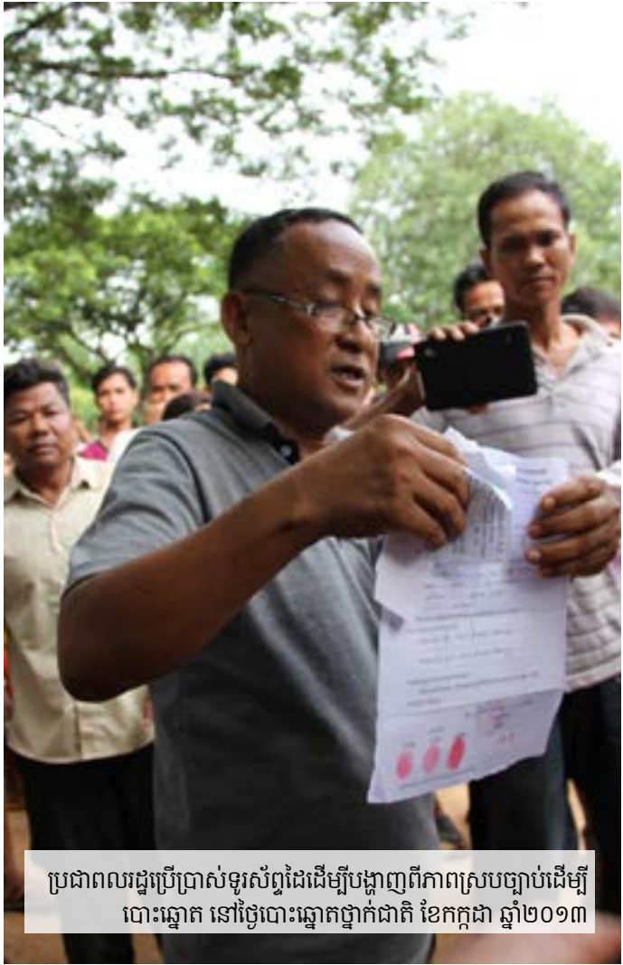
ប្រជាពលរដ្ឋប្រើប្រាស់ទូរស័ព្ទដៃដើម្បីបង្ហាញពីភាពស្របច្បាប់ដើម្បីបោះឆ្នោត នៅថ្ងៃបោះឆ្នោតជាតិ ខែកក្កដា ឆ្នាំ២០១៣

ទោះបីជារដ្ឋាភិបាលមានការសង្ស័យយ៉ាងខ្លាំង លើប្រព័ន្ធអ៊ីនធឺណិត និងបើទោះជា រដ្ឋាភិបាលព្យាយាមគ្រប់គ្រងលើប្រព័ន្ធអ៊ីនធឺណិតតាំងពីដើមទីក៏ដោយ ក៏ប៉ុន្តែរដ្ឋាភិបាលនៅតែមិនអាចតាមទាន់ល្បឿននៃការប្រើប្រាស់ប្រព័ន្ធអ៊ីនធឺណិតទូទៅរបស់ប្រជាជន និងព័ត៌មានវិទ្យា និងការប្រើប្រាស់ប្រព័ន្ធអ៊ីនធឺណិត ដែលមានសន្ទុះយ៉ាងលឿននេះឡើយ។ ការបោះឆ្នោតជាតិ នៅថ្ងៃទី២៨ ខែកក្កដា ឆ្នាំ២០១៣ កន្លងទៅ ជាព្រឹត្តិការណ៍ថ្មីមួយគួរកត់សំគាល់ ពេលដែលប្រជាពលរដ្ឋកម្ពុជាច្រើនលើសលប់បានទៅបោះឆ្នោត ដើម្បីឲ្យមានការផ្លាស់ប្តូរ។ យោងតាមលទ្ធផលជាផ្លូវការ ដែលបានចេញផ្សាយដោយគណៈកម្មាធិការជាតិរៀបចំការបោះឆ្នោត (គ.ជ.ប.) បានបង្ហាញថា អាសនៈរបស់គណបក្សកាន់អំណាចបានថយចុះពីចំនួន ៩០ អាសនៈ