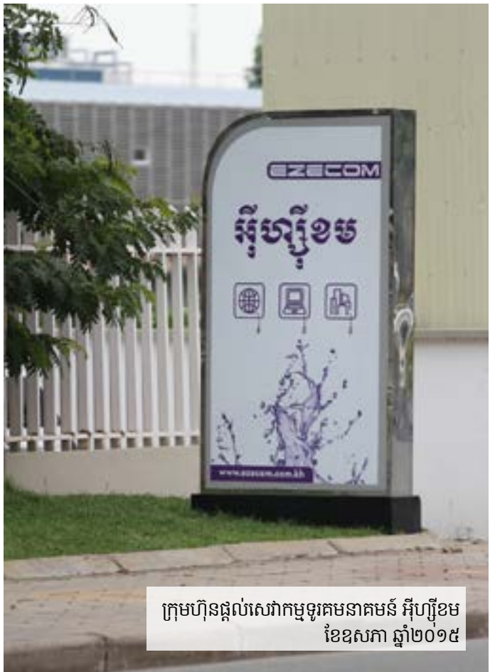
ក្រុមហ៊ុនផ្តល់សេវាអ៊ីនធឺណិតមួយចំនួន អ៊ីប៊ូខេម ខែឧសភា ឆ្នាំ២០១៥

គេហទំព័រ KI-Media បានធ្វើឲ្យរដ្ឋាភិបាលមានកំហឹងយ៉ាងខ្លាំង។ មួយថ្ងៃមុនការឃាត់ខ្លួនលោក គុណការ ឯកឧត្តម វ៉ា គីមហុង ទេសរដ្ឋមន្ត្រី និងជាប្រធានគណៈកម្មការព្រំដែនរបស់រដ្ឋាភិបាល (ម្នាក់ក្នុងចំណោមមន្ត្រីរដ្ឋាភិបាលដែលត្រូវបានគេវិះគន់នៅលើគេហទំព័រ KI-Media) បានប្រាប់វិទ្យុអាស៊ីសេរីថា លោកធ្លាប់បានស្នើសុំឲ្យរដ្ឋាភិបាលបិទគេហទំព័រនេះនៅចុងខែធ្នូ។ ២៧ រយៈពេលមួយខែក្រោយមក អ្នកប្រើប្រាស់អ៊ីនធឺណិតមួយចំនួនចាប់ផ្ដើមកត់សម្គាល់ថា ពួកគេមិនអាចចូលទៅមើលបណ្ដុំគេហទំព័រមួយ ដែលជាទីពេញនិយមឈ្មោះ: blogspot.com ដែលប្លុកនេះមានផ្ទុកគេហទំព័រ KI-Media និងប្លុកនយោបាយមួយចំនួនទៀត តាមរយៈក្រុមហ៊ុនផ្តល់សេវាអ៊ីនធឺណិតមួយចំនួន ក្នុងនោះក៏មានក្រុមហ៊ុន Metfone និង Ezeecom ផងដែរ។ គេហទំព័រផ្សេងទៀតដែលជំទាស់នឹងរដ្ឋាភិបាលទំនងជាត្រូវបានបិទមិនឲ្យចូលទៅមើលទៀតបាន ក្នុងនោះក៏មានគេហទំព័រមួយដែលដំណើរការដោយលោក អ៊ុង ប៊ុនហៀង (លោកមានសញ្ជាតិខ្មែរ-អូស្ត្រាលី ដែលលោកបានទទួលមរណៈភាពហើយ) លោកជាអ្នកគូររូបកំប្លែងទាក់ទងនឹងរឿងនយោបាយ បានបង្កើតរូបត្ថកមួយមានឈ្មោះថា សាក់ក្រវ៉ា ជូន "Sacrava Toons" នៅក្នុងរូបត្ថកនោះ បានប្រើពាក្យសម្តីវាយប្រហារលើគណបក្សកាន់អំណាច និងជនជាតិវៀតណាម។