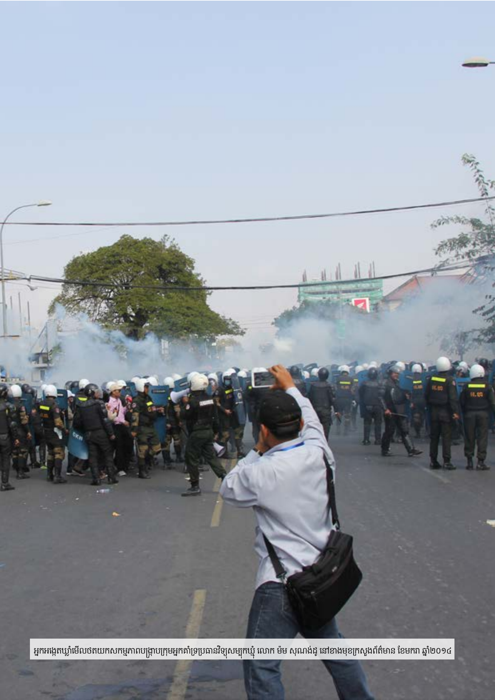
អ្នកអង្កេតឃ្នាំមើលថតយកសកម្មភាពបង្ក្រាបក្រុមអ្នកគាំទ្រប្រធានវិទ្យុសម្បុកឃ្នាំ លោក ម៉ម សុណាងដូ នៅខាងមុខក្រសួងព័ត៌មាន ខែមករា ឆ្នាំ២០១៤