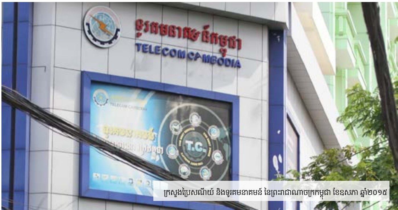
ក្រសួងប្រៃសណីយ៍ និងទូរគមនាគមន៍ នៃព្រះរាជាណាចក្រកម្ពុជា ខែឧសភា ឆ្នាំ២០១៥

នៅពេលដែលមន្ត្រីនៃក្រសួងមួយចំនួន បានចេញលិខិតបដិសេធនោះ ៣០ ក៏ប៉ុន្តែនៅក្នុងពេលជាមួយគ្នានោះដែរ ក៏មានសារព័ត៌មានមួយដែលចេញផ្សាយជាភាសាអង់គ្លេស បានចុះផ្សាយអំពីការលេចធ្លាយកំណត់ហេតុកិច្ចប្រជុំមួយ ដែលមានវត្តមានរដ្ឋមន្ត្រីក្រសួងប្រៃសណីយ៍ និងទូរគមនាគមន៍ ធ្វើជាប្រធានដឹកនាំកិច្ចប្រជុំកាលពីថ្ងៃទី១០ ខែកុម្ភៈ នៅពេលនោះ ឯកឧត្តម បានស្នើឲ្យក្រុមហ៊ុនផ្តល់សេវាទូរស័ព្ទចូលរំកិល ចូលរួមសហការបិទនូវការប្រើប្រាស់គេហទំព័រមួយចំនួន “ដែលប៉ះពាល់ដល់សីលធម៌ និងប្រពៃណីជាតិ និងរដ្ឋាភិបាល។” ៣១ ករណីខាងលើនេះ កាន់តែបញ្ជាក់ឲ្យគេមើលឃើញកាន់តែច្បាស់ ដោយសារការលេចធ្លាយនូវលិខិតតាមអ៊ីមែលមួយ ដែលចេញដោយមន្ត្រីជាន់ខ្ពស់ នៃក្រសួងប្រៃសណីយ៍ និងទូរគមនាគមន៍ ដែលខ្លឹមសារក្នុងលិខិតនោះ សរសេរថា លោកសាទរដល់ក្រុមហ៊ុនផ្តល់សេវាអ៊ីនធឺណិតចំនួន១០ ក្នុងនោះក៏មានក្រុមហ៊ុន Ezeecom ផងដែរ ដែលបានបិទមិនឲ្យចូលមើលគេហទំព័រមួយចំនួនដូចមាននៅក្នុងបញ្ជី។ នៅក្នុងបញ្ជីនោះ ក៏មានគេហទំព័រ KI-Media និងគេហទំព័រពីរទៀតដែលមានទំនាក់ទំនងគ្នា គឺ “Khmerization និង Sacrava Toons” ។ មន្ត្រីរូបនេះ ក៏បានបញ្ជាក់ឈ្មោះក្រុមហ៊ុនផ្តល់សេវាអ៊ីនធឺណិតចំនួន៣ មាន TeleSurf WiCAM និង Hello ដែលក្រុមហ៊ុនទាំងបីនេះ មិនទាន់បានបិទគេហទំព័រដូចមាននៅក្នុងបញ្ជី ហើយមន្ត្រីរូបនេះក៏បានអំពាវនាវឲ្យក្រុមហ៊ុនទាំងនេះ បិទការប្រើប្រាស់គេហទំព័រទាំងនោះ។ មន្ត្រីរូបនេះ បានសរសេរនៅក្នុងអ៊ីមែលទៀតថា “យើងបានរកឃើញថាក្រុមហ៊ុនរបស់លោកមិនទាន់បានអនុវត្តតាមការស្នើសុំនៅឡើយទេ ហេតុដូច្នេះសូមលោកមេត្តាចាត់វិធានការជាបន្ទាន់។” ៣២ នៅពេលដែលអ្នកយកព័ត៌មានពី ខេមបូឌា-