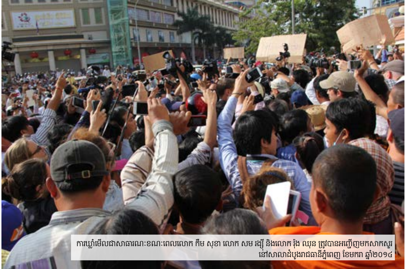
ការឃ្នាំមើលជាសាធារណៈខណៈពេលលោក កឹម សុខា លោក សម រង្ស៊ី និងលោក រ៉ុង ឈុន ត្រូវបានអញ្ជើញមកសាកសួរនៅសាលាដំបូងរាជធានីភ្នំពេញ ខែមករា ឆ្នាំ២០១៤

ក្នុងអំឡុងពេលបោះឆ្នោតជាតិ កាលពីខែកក្កដា ឆ្នាំ២០១៣ កន្លងទៅនេះ ឥទ្ធិពលនៃប្រព័ន្ធផ្សព្វផ្សាយព័ត៌មានសង្គម បានផ្តល់ផលប្រយោជន៍យ៉ាងធំធេង ហួសពីការរំពឹងទុកដល់គណបក្សសង្គ្រោះជាតិ។ ៣ ក្នុងអំឡុងពេលយុទ្ធសាស្ត្របោះឆ្នោត និងការជាប់