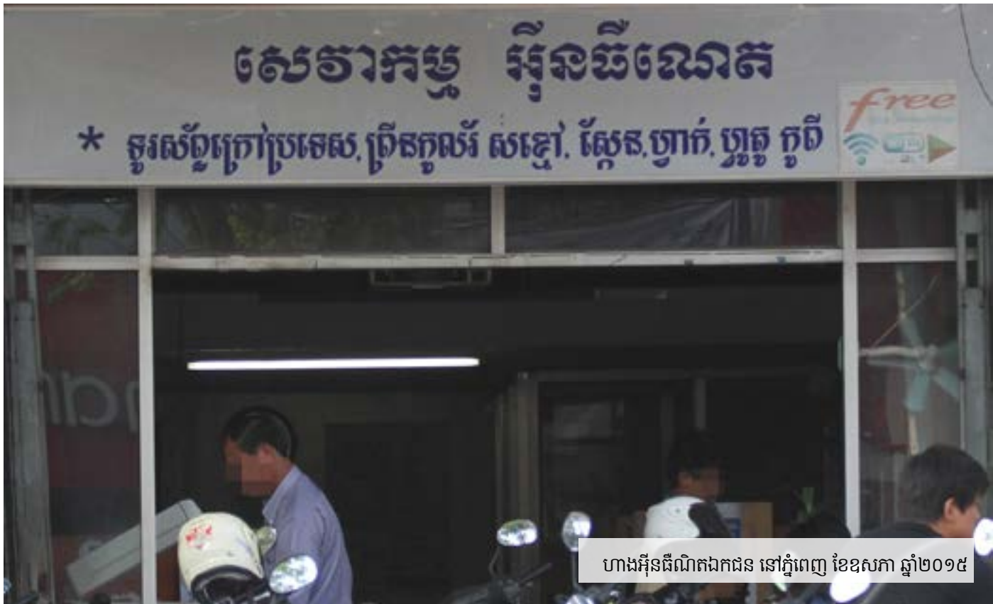
ហាងអ៊ុនធឺណេតឯកជន នៅភ្នំពេញ ខែឧសភា ឆ្នាំ២០១៥