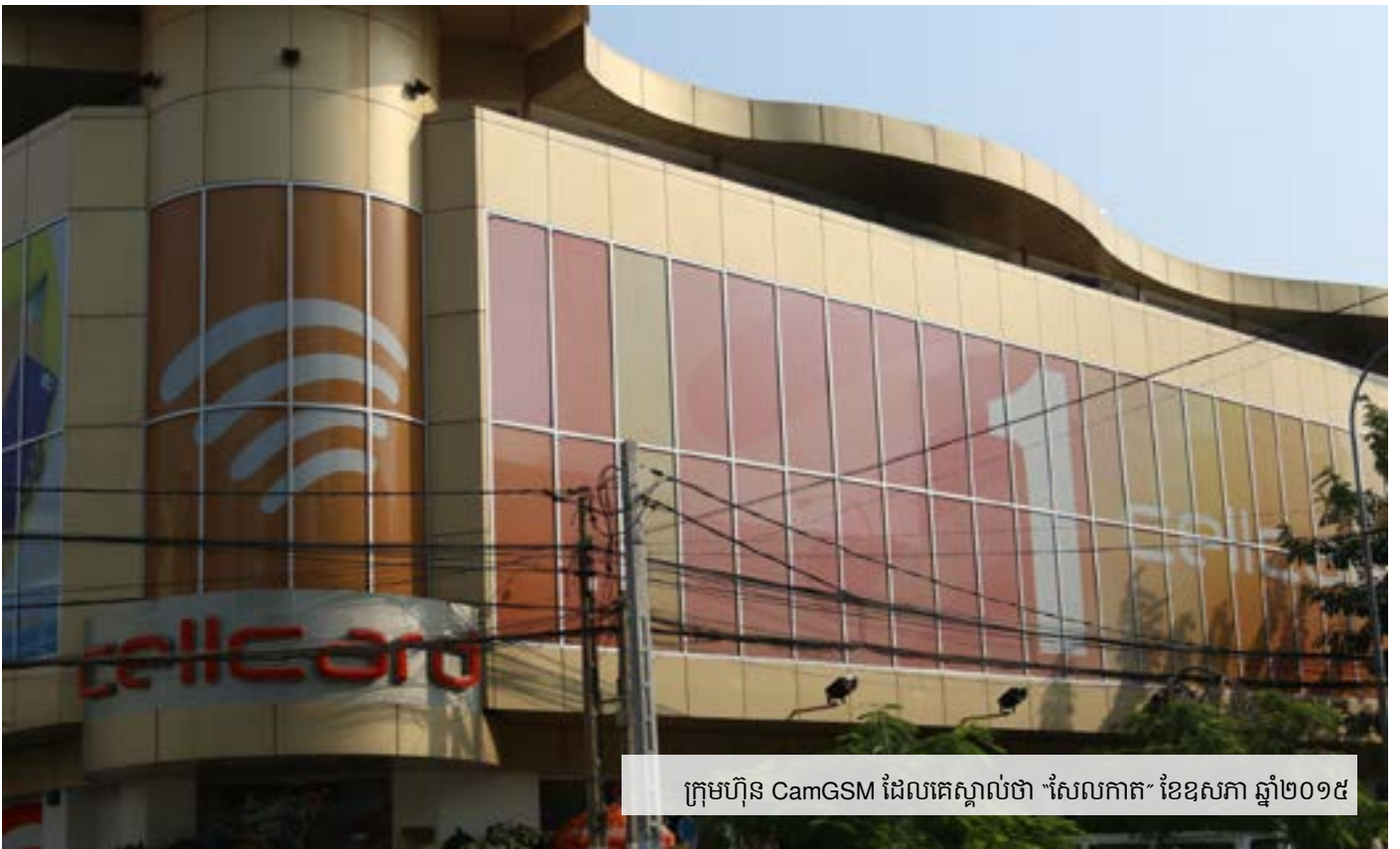
ក្រុមហ៊ុន CamGSM ដែលគេស្គាល់ថា "សែលកាត" ខែឧសភា ឆ្នាំ២០១៥