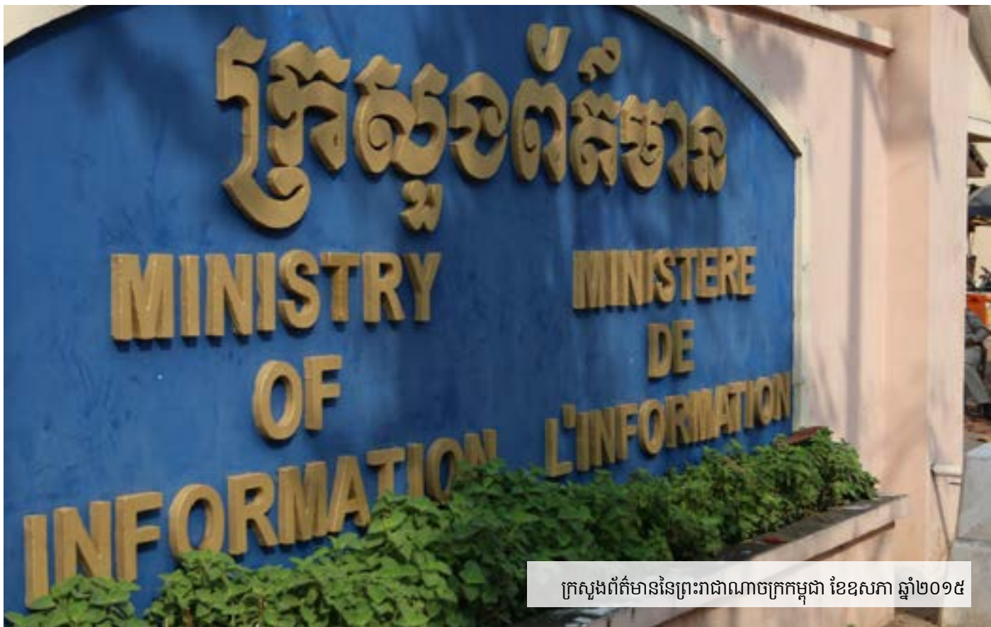
ក្រសួងព័ត៌មាននៃព្រះរាជាណាចក្រកម្ពុជា ខែឧសភា ឆ្នាំ២០១៥