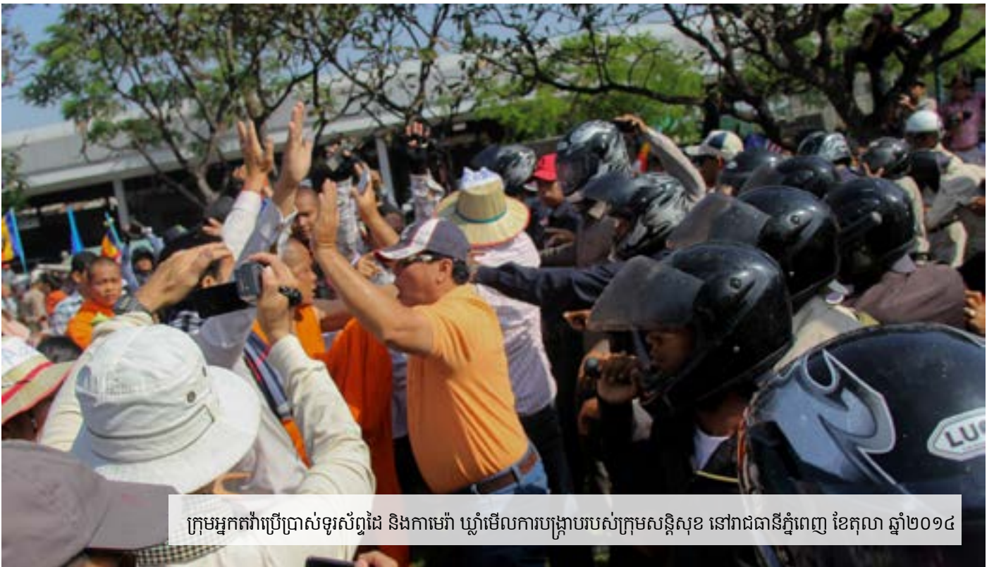
ក្រុមអ្នកតវ៉ាប្រើប្រាស់ទូរស័ព្ទដៃ និងការមេរ៉ា ឃ្នាំមើលការបង្ក្រាបរបស់ក្រុមសន្តិសុខ នៅរាជធានីភ្នំពេញ ខែតុលា ឆ្នាំ២០១៤

ជនមិនស្គាល់មុខត្រូវបានដាក់ពង្រាយដោយរដ្ឋាភិបាល ដើម្បីទប់ទល់នឹងអ្នកតវ៉ា នៅពេលនោះដែរ មានសកម្មជន និងអ្នកកាសែត បានថតវីដេអូពីការបង្ក្រាប និងបានបញ្ជូនព័ត៌មានទាំងនេះទៅក្នុងប្រព័ន្ធបណ្តាញទំនាក់ទំនងសង្គមហ្វេសប៊ុក (Facebook) និង Youtube។ វីដេអូមួយបានដាក់ចូលក្នុងប្រព័ន្ធ Youtube ដែលមានចំណងជើងថា វាយ វាយ វាយ (Fight Fight Fight) និងបានបង្ហាញពីកងកម្លាំងសន្តិសុខ ធ្វើការវាយទៅលើយុវជនក្មេងៗដែលគ្មានកំលាំងទប់ទល់។ ៤៥