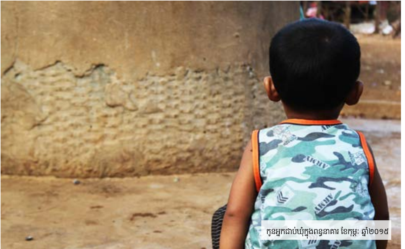
កូនអ្នកជាប់ឃុំក្នុងពន្ធនាគារ ខែកុម្ភៈ ឆ្នាំ២០១៥