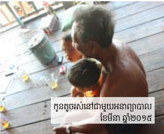
កូនតូចរស់នៅជាមួយអនាព្យាបាល ខែមីនា ឆ្នាំ២០១៥

ស្ត្រីមួយចំនួន ដែលត្រូវបាន សម្ភាសដោយអង្គការ លីកាដូ បានឲ្យ ដឹងថា កូនរបស់ពួកគាត់ ស្នាក់នៅជា មួយ ដោយសារមូលហេតុសាមញ្ញ គឺអ្នក ទាំងនោះកំពុងនៅជាមួយគ្នា នៅពេលគេ ឃាត់ខ្លួន និងមិនមានវត្តមានអ្នកណា ម្នាក់ ដែលអាចមើលថែកូនទាំងនោះ នៅ ក្រៅពន្ធនាគារបានភ្លាមៗនោះទេ។ អ្នក ដទៃទៀត បានរាយការណ៍ថា នគរបាល ហាមឃាត់យ៉ាងសកម្ម មិនអោយអ្នក