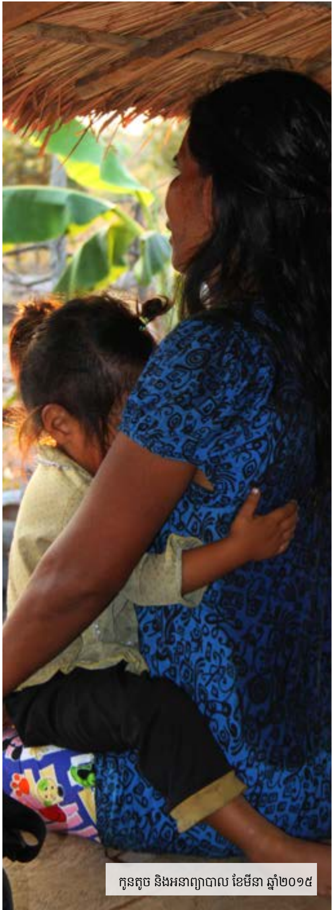
កូនតូច និងអនាព្យាបាល ខែមីនា ឆ្នាំ២០១៥

ជាការសំខាន់ ការជួបសួរសុខទុក្ខរវាងម្តាយ និងកូន គួរតែត្រូវបានអនុញ្ញាតជាការជួបផ្ទាល់ផ្ទៃក្របរាងកាយ និងត្រូវបានធ្វើឡើងក្នុងស្ថានភាពដែលមានភាពឯកជន និងនៅក្នុងបរិយាកាសធម្មជាតិ ឲ្យបានច្រើនតាមដែលអាចធ្វើទៅបាន។ ម្តាយ គួរតែមិនត្រូវបានដាក់ឲ្យចេញពីកូនដោយរបាំងដែក ឬមើលគ្នាតាមកញ្ចក់នោះទេ ហើយបរិយាកាសនៅជុំវិញកន្លែងជួបគ្នា មិនគួរផ្អែកលើស្ថានភាពហិរញ្ញវត្ថុនោះទេ។ ម្តាយគួរតែត្រូវបានអនុញ្ញាតឲ្យនិយាយជាមួយកូនរបស់អ្នកទាំងនោះ តាមទូរស័ព្ទជាទៀងទាត់សម្រាប់ពេលវេលាសមរម្យណាមួយ និងគួរតែមិនត្រូវបានហាមឃាត់ពីការធ្វើបែបនេះដោយផ្អែកលើកត្តាហិរញ្ញវត្ថុនោះទេ។ នេះជាការសំខាន់ណាស់សម្រាប់អ្នកដែលមានក្រុមគ្រួសាររស់នៅឆ្ងាយឬមិនអាចមកសួរសុខទុក្ខជាទៀងទាត់។