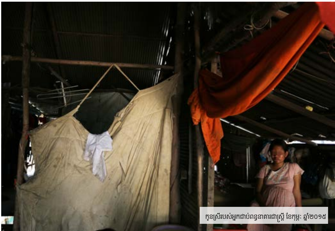
កូនស្រីរបស់អ្នកជាប់ពន្ធនាគារជាស្រ្តី ខែកុម្ភៈ ឆ្នាំ២០១៥