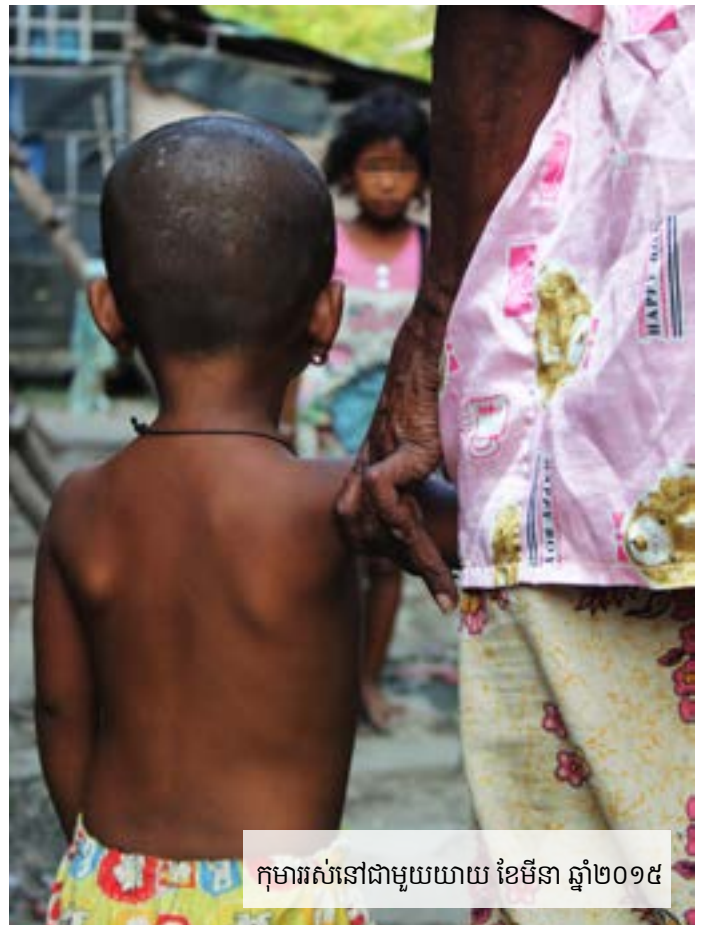
កុមាររស់នៅជាមួយយាយ ខែមីនា ឆ្នាំ២០១៥