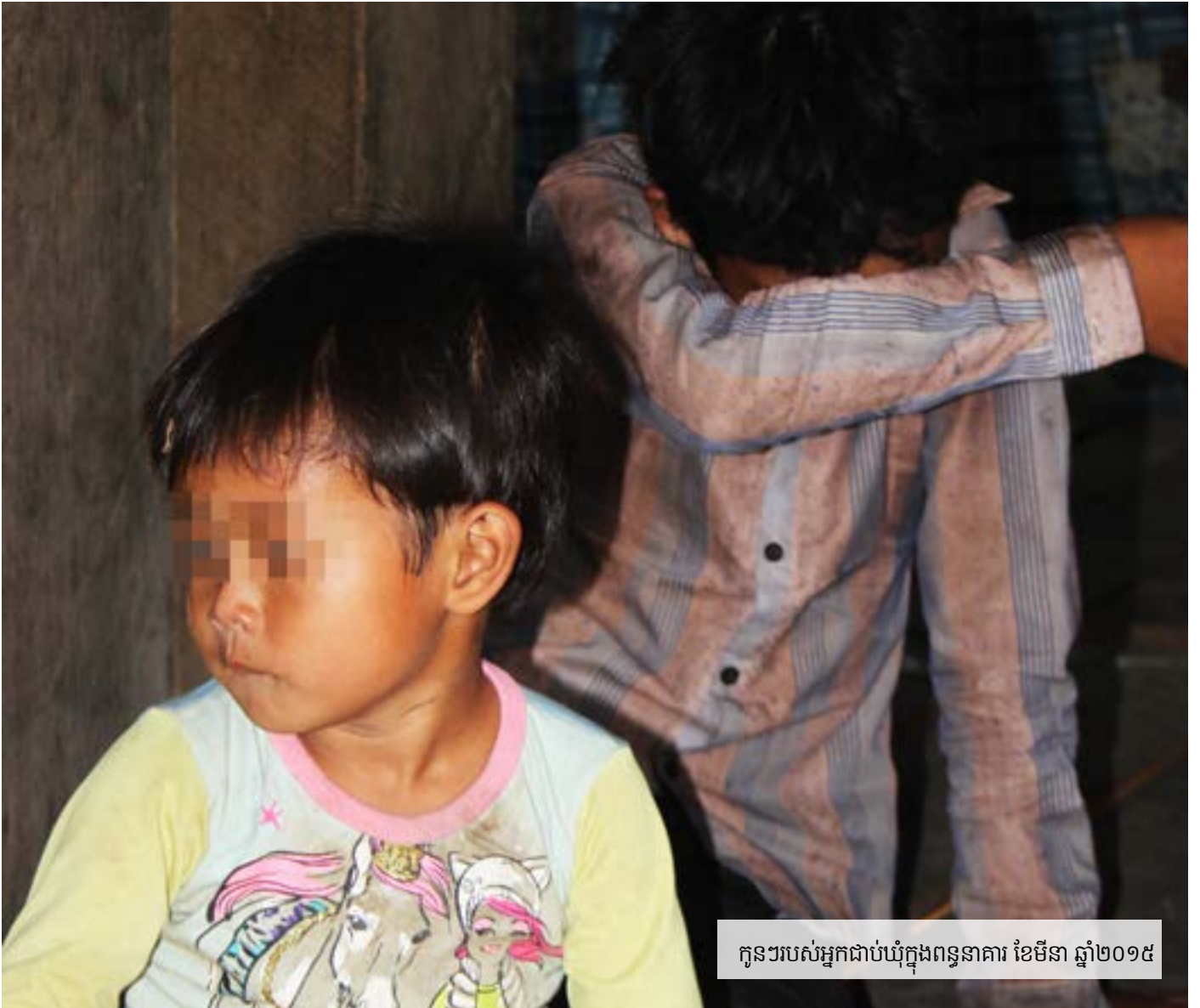
កូនរបស់អ្នកជាប់ឃុំក្នុងពន្ធនាគារ ខែមីនា ឆ្នាំ២០១៥