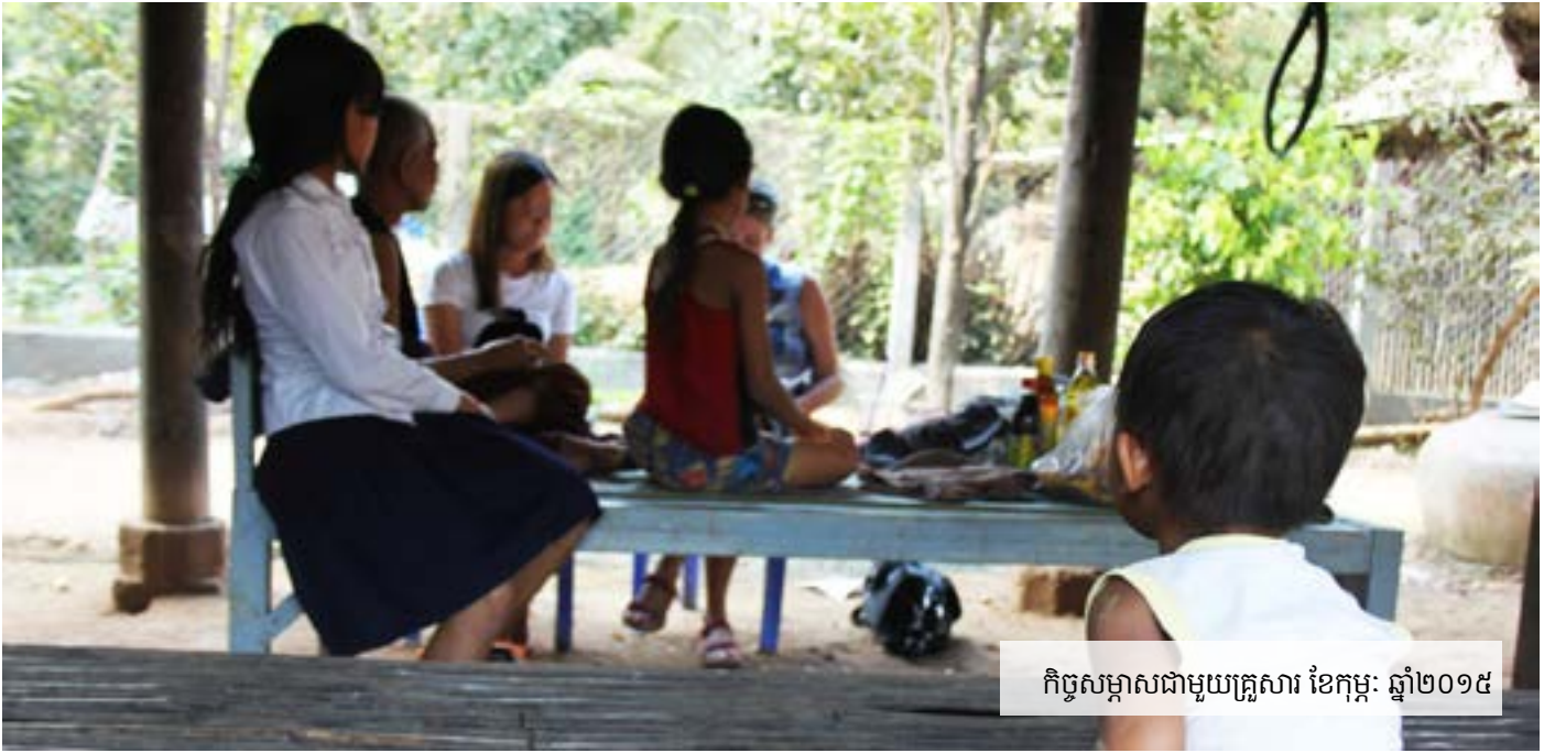
កិច្ចសម្ភាសជាមួយគ្រួសារ ខែកុម្ភៈ ឆ្នាំ២០១៥