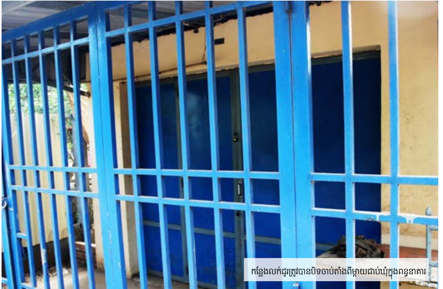
កន្លែងលក់ដូរត្រូវបានបិទចាប់តាំងពីម្តាយជាប់ឃុំក្នុងពន្ធនាគារ

អនុសាសន៍មួយចំនួន ស្តីពីការឃាត់ខ្លួននិងការឃុំឃាំង សវនាការ និងការដាក់ទោសម្តាយ។ អង្គការ លីកាដូ ក៏បានផ្តល់អនុសាសន៍ សម្រាប់ការអនុវត្តបំផុត គឺនៅពេលណាដែលការដាក់ពន្ធនាគារ នោះ គឺជាជម្រើសតែមួយគត់។ ក្នុងករណីនេះ អង្គការ លីកាដូ រៀប រាប់យ៉ាងពិស្តារ អំពីពេលវេលាដែលសមស្របសម្រាប់ឲ្យកុមារនៅជា មួយម្តាយ និងអំពីការធានាការពារ ដែលត្រូវតែដាក់ឲ្យអនុវត្តដើម្បី ធានាពីសុវត្ថិភាព និងសុខុមាលភាពរបស់កុមារ។