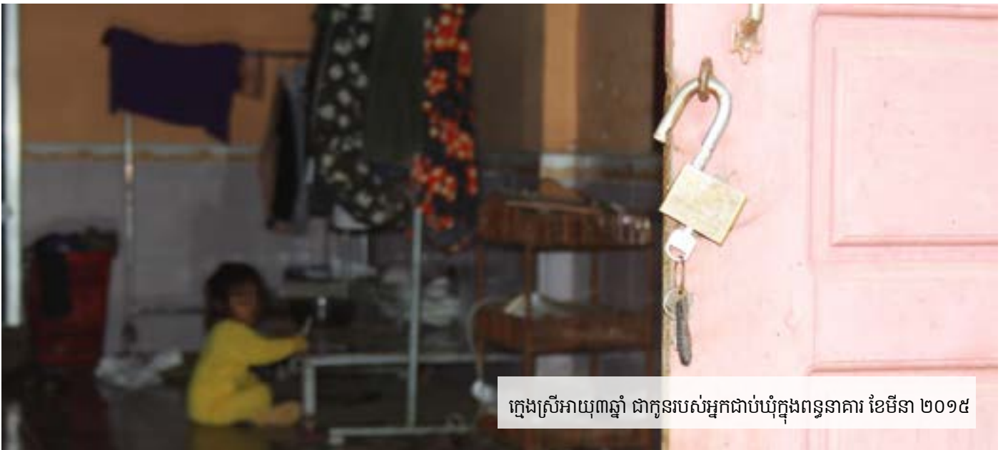
ក្មេងស្រីអាយុ៣ឆ្នាំ ជាកូនរបស់អ្នកជាប់ឃុំក្នុងពន្ធនាគារ ខែមីនា ២០១៥