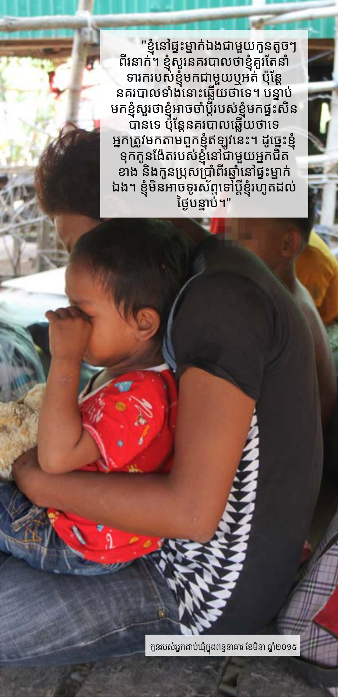
កូនរបស់អ្នកជាប់ឃុំក្នុងពន្ធនាគារ ខែមីនា ឆ្នាំ២០១៥

"ខ្ញុំនៅផ្ទះម្នាក់ឯងជាមួយកូនតូចៗពីរនាក់។ ខ្ញុំស្មានគរបាលថាខ្ញុំគួរតែនាំទារករបស់ខ្ញុំមកជាមួយប្តីអត់ ប៉ុន្តែនគរបាលទាំងនោះឆ្លើយថាទេ។ បន្ទាប់មកខ្ញុំសួរថាខ្ញុំអាចចាំប្តីរបស់ខ្ញុំមកផ្ទះសិនបានទេ ប៉ុន្តែនគរបាលឆ្លើយថាទេ អ្នកត្រូវមកតាមពួកខ្ញុំឥឡូវនេះ។ ដូច្នេះខ្ញុំទុកកូនដៃតរបស់ខ្ញុំនៅជាមួយអ្នកជិតខាង និងកូនប្រុសប្រាំពីរឆ្នាំនៅផ្ទះម្នាក់ឯង។ ខ្ញុំមិនអាចទូរស័ព្ទទៅប្តីខ្ញុំរហូតដល់ថ្ងៃបន្ទាប់។"