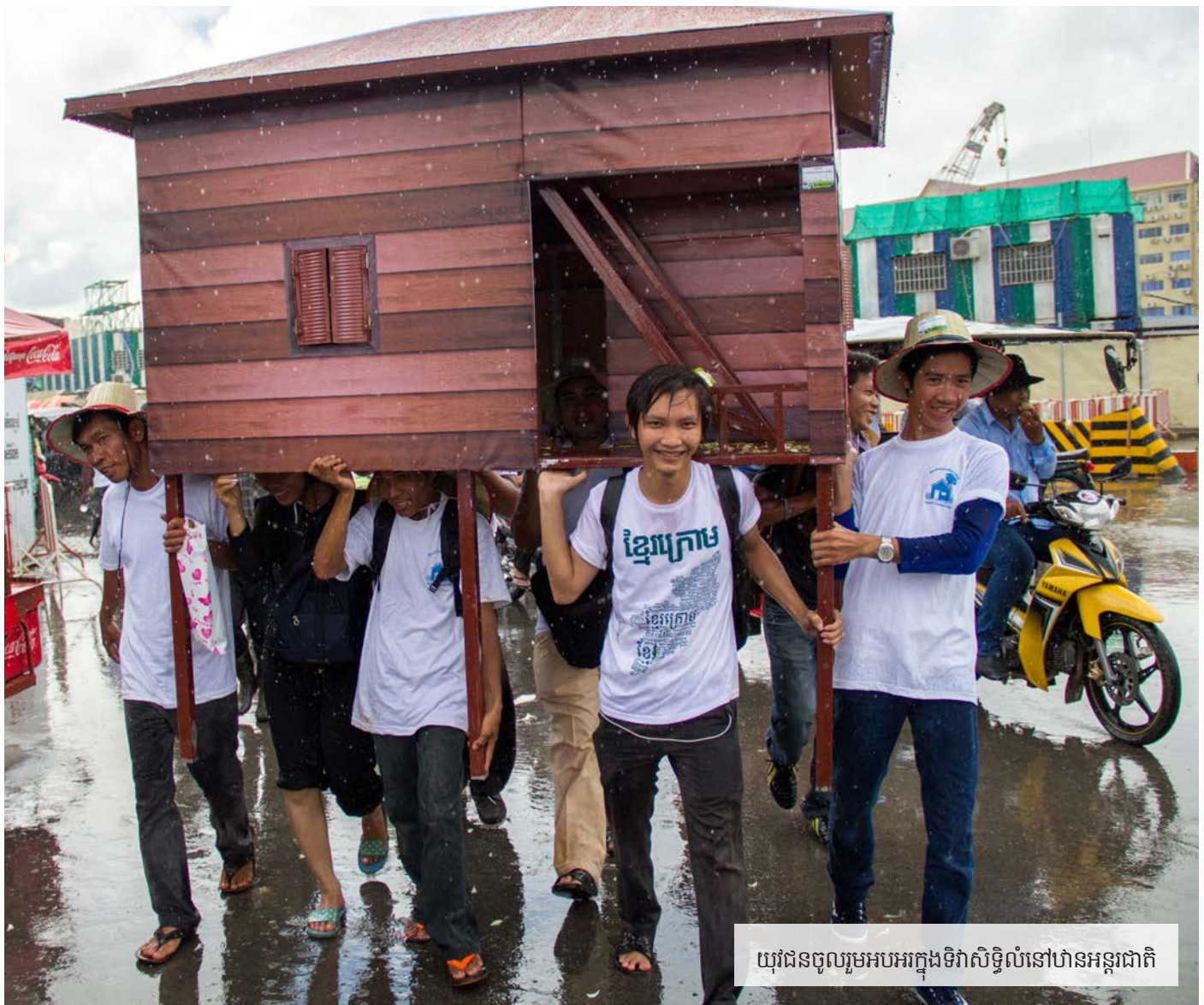
យុវជនចូលរួមអបអរក្នុងទិវាសិទ្ធិលំនៅឋានអន្តរជាតិ