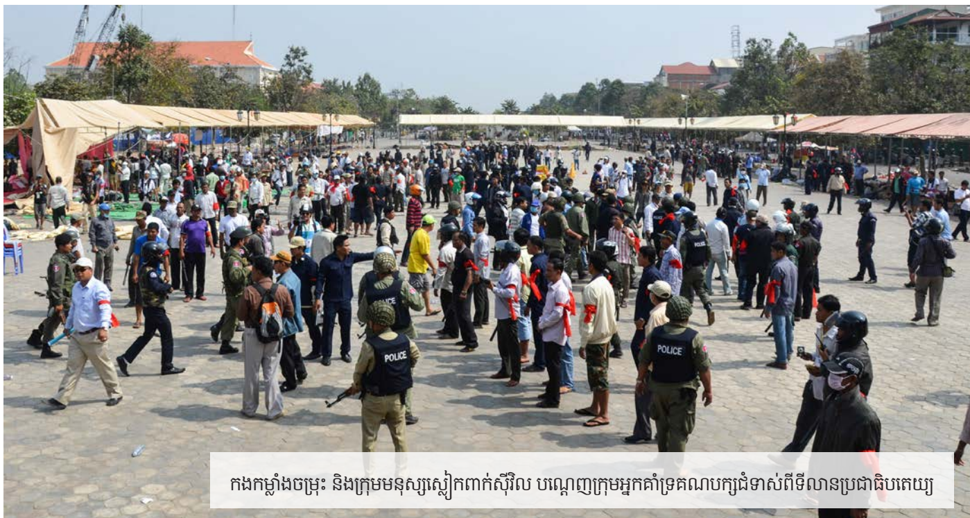
កងកម្លាំងចម្រុះ និងក្រុមមនុស្សស្លៀកពាក់ស៊ីវិល បណ្តេញក្រុមអ្នកគាំទ្រគណបក្សជំទាស់ពីទីលានប្រជាធិបតេយ្យ