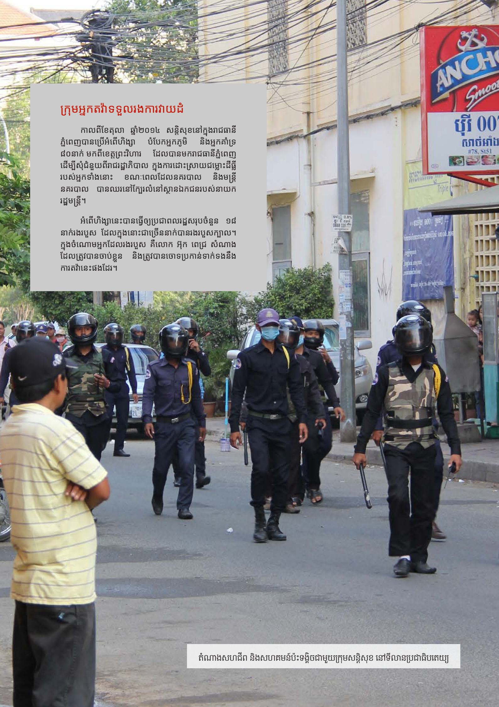
តំណាងសហជីព និងសហគមន៍ប៉ះទង្គិចជាមួយក្រុមសន្តិសុខ នៅទីលានប្រជាធិបតេយ្យ