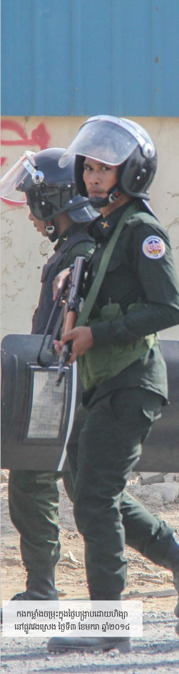
កងកម្លាំងចម្រុះក្នុងថ្ងៃបង្ក្រាបដោយហិង្សា នៅផ្លូវវង់ស្រែង ថ្ងៃទី៣ ខែមករា ឆ្នាំ២០១៤