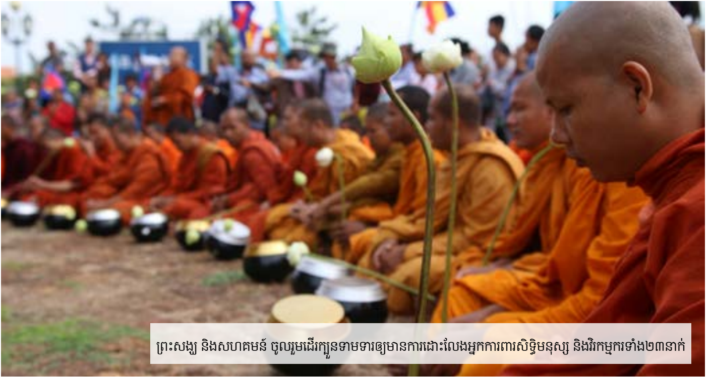
ព្រះសង្ឃ និងសហគមន៍ ចូលរួមដើរក្បួនទាមទារឲ្យមានការដោះលែងអ្នកការពារសិទ្ធិមនុស្ស និងវិកម្មករទាំង២៣នាក់