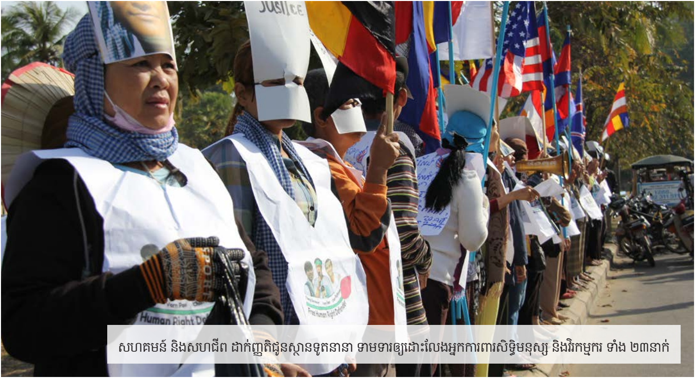
សហគមន៍ និងសហជីព ដាក់ញតិជូនស្ថានទូតនានា ទាមទារឲ្យដោះលែងអ្នកការពារសិទ្ធិមនុស្ស និងអ្នកកម្ម ទាំង ២៣នាក់