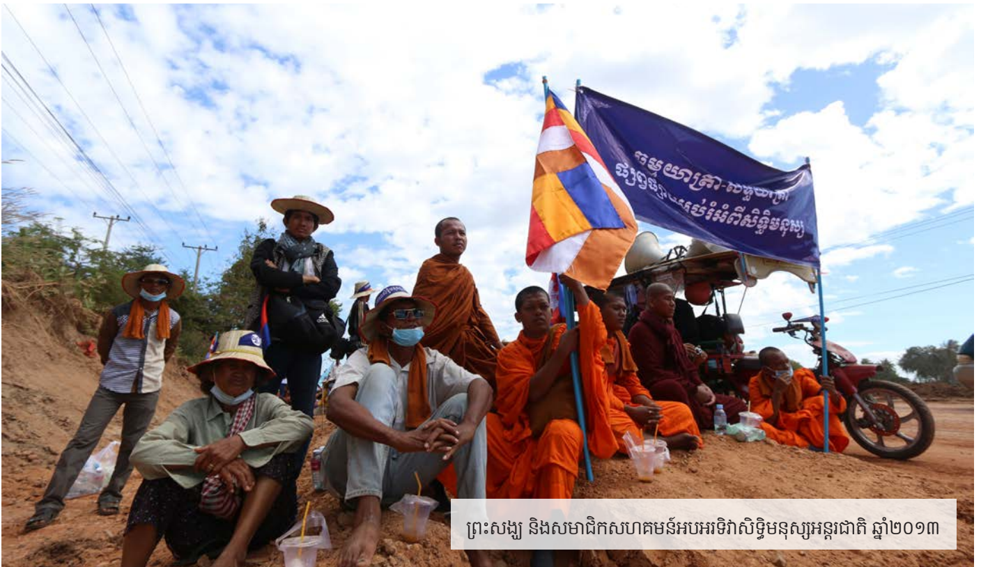
ព្រះសង្ឃ និងសមាជិកសហគមន៍អបអរសាទរសិទ្ធិមនុស្សអន្តរជាតិ ឆ្នាំ២០១៣