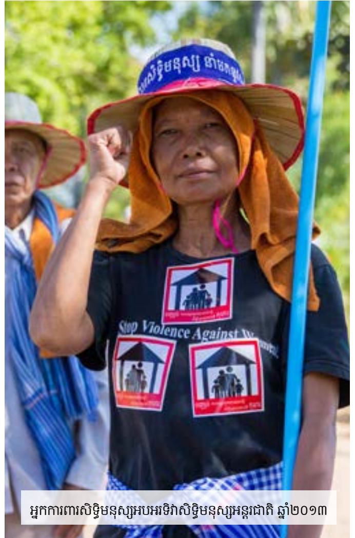
អ្នកការពារសិទ្ធិមនុស្សរបស់អង្គការសិទ្ធិមនុស្សអន្តរជាតិ ឆ្នាំ២០១៣

ឧបសម្ព័ន្ធ ១៖ អ្នកការពារសិទ្ធិមនុស្ស នៅកម្ពុជា (២០១៣ និង ២០១៤) ទំព័រ ១៧