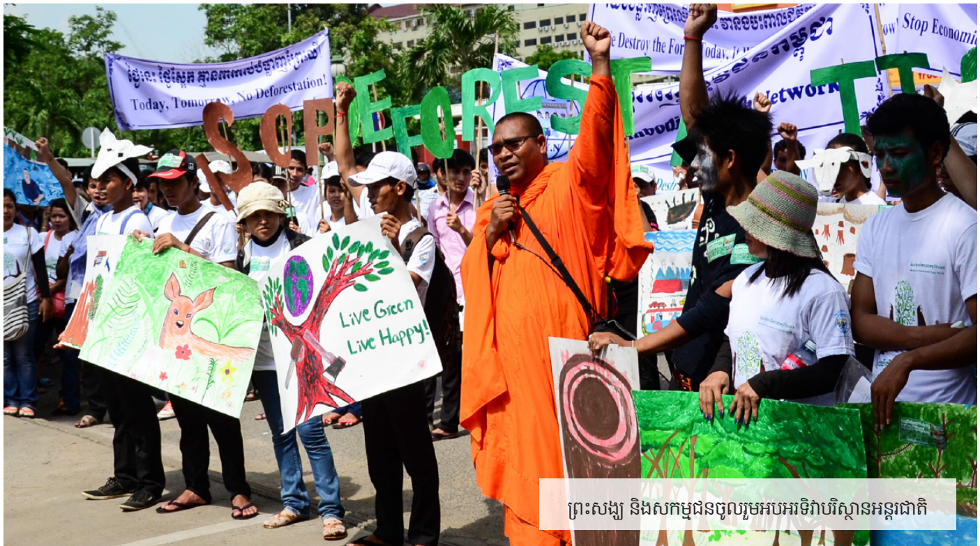
ព្រះសង្ឃ និងសកម្មជនចូលរួមអបអរសាទរឲ្យបរិស្ថានអន្តរជាតិ

ទោះយ៉ាងណា សហជីពនៅតែមានការប្តេជ្ញាចិត្តចំពោះការតស៊ូរបស់អ្នកទាំងនោះ និងបន្តទាមទារឲ្យមានការអនុវត្តស្មើភាពសម្រាប់កម្មករកម្ពុជា។ បន្ទាប់ពីការចាប់ខ្លួនអ្នកការពារសិទ្ធិមនុស្សនិងកម្មករ ២៣ នាក់ ក្នុងអំឡុងពេលនៃការបង្ក្រាបហិង្សាលើ ការធ្វើកូដកម្មរបស់កម្មកររោងចក្រកាត់ដេរ នៅខែ មករា ឆ្នាំ ២០១៤ អ្នកការពារសិទ្ធិមនុស្សមកពីសហគមន៍ និងសហជីពរបស់អ្នកទាំងនោះរួមគ្នានៅក្នុងការអំពើនាំឲ្យមានការដោះលែងពួកគេម្តងហើយ ម្តងទៀតដោយធ្វើការទប់ទល់នឹងការបង្ក្រាបដោយហិង្សា ក៏ដូចជាការឃុំខ្លួនដោយមិនត្រឹមត្រូវអ្នកតវ៉ាទាំងនោះ។