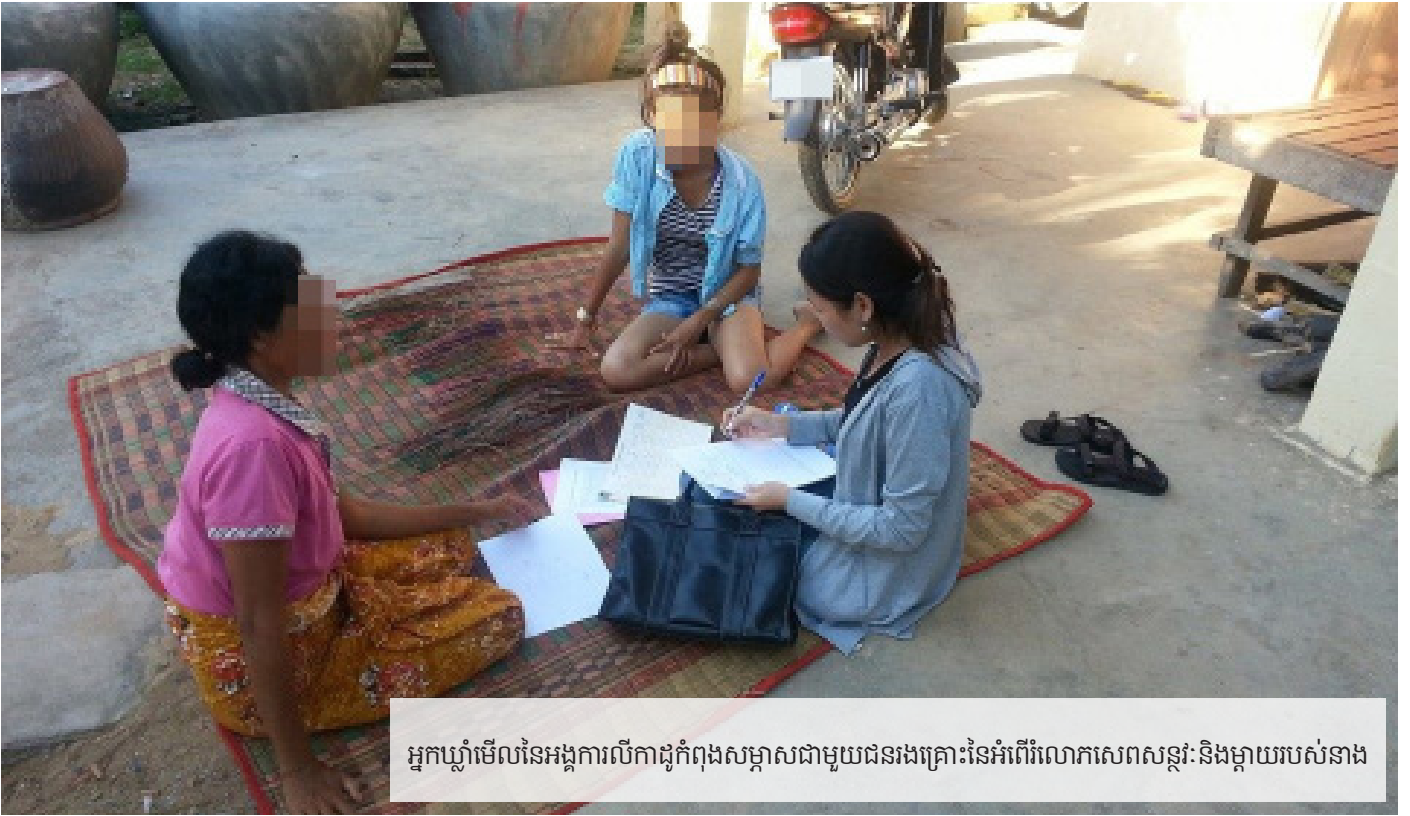
អ្នកឃ្លាំមើលនៃអង្គការលើកាដូកំពុងសម្ភាសជាមួយជនរងគ្រោះនៃអំពើហិង្សាសេពសន្ថវៈ និងម្តាយរបស់នាង