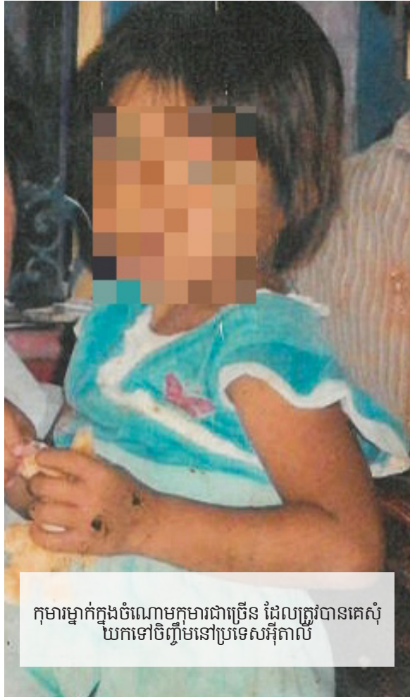
កុមារម្នាក់ក្នុងចំណោមកុមារជាច្រើន ដែលត្រូវបានគេសុំ យកទៅចិញ្ចឹមនៅប្រទេសអ៊ីតាលី

មណ្ឌលកុមារកំព្រា ដើម្បីបានទៅរៀន ហើយពេលធំឡើង នាងមិនចង់ធ្វើការងារដូចម្តាយឪពុក នាងទេ។ ស្ត្រីជា ម្តាយ បានសួរទៅអ្នកជិតខាងនោះ ពីលេខទំនាក់ទំនងទៅ ប្រធានមណ្ឌលកុមារកំព្រា ហើយប្រហែលមួយសប្តាហ៍ ក្រោយ ប្រធានមណ្ឌលនោះ បានធ្វើដំណើរពីភ្នំពេញមក ជួបក្រុមគ្រួសាររបស់នាង។ គាត់បានពន្យល់ថា កូនៗ នាង អាចរស់នៅក្នុងមណ្ឌលនោះដោយឥតបង់ប្រាក់ និង