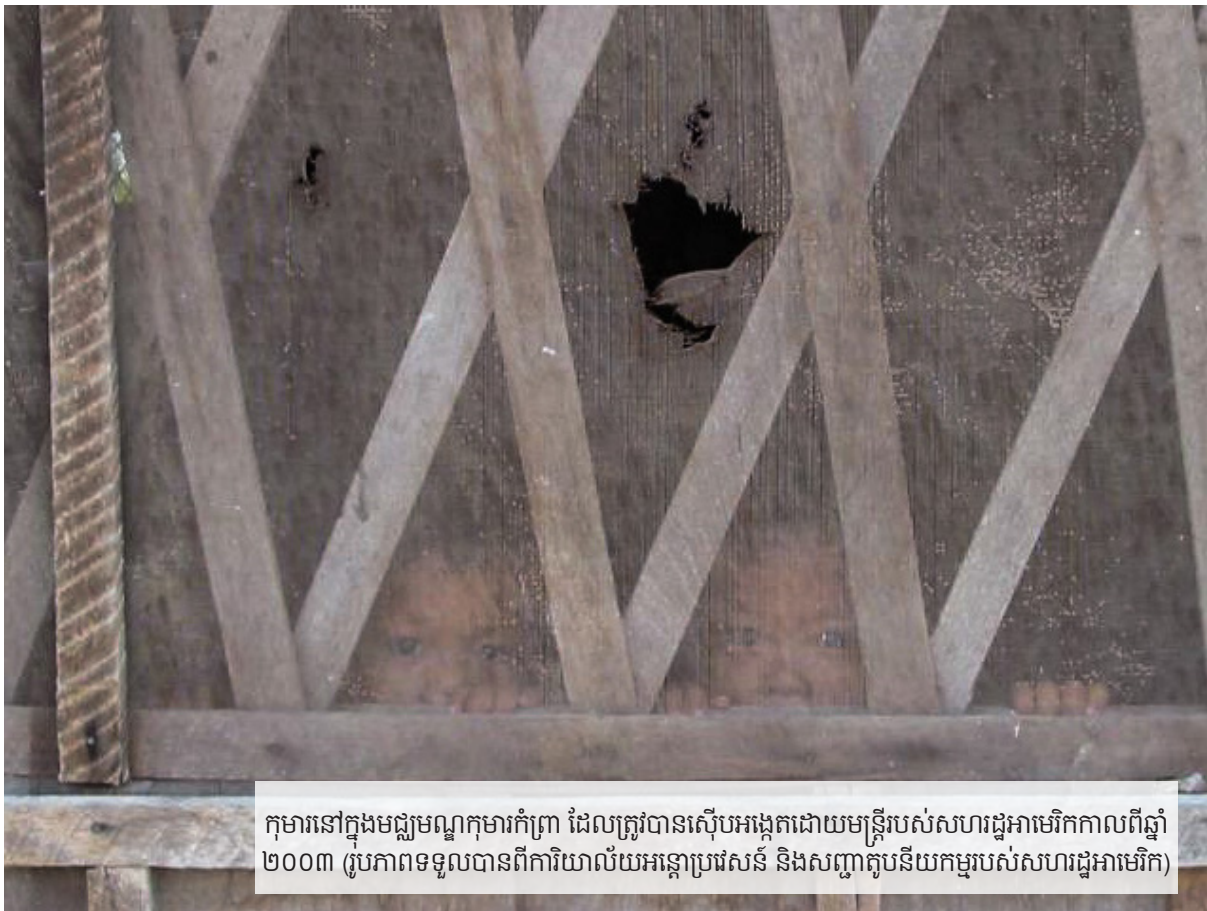
កុមារនៅក្នុងមជ្ឈមណ្ឌលកុមារកំព្រា ដែលត្រូវបានស៊ើបអង្កេតដោយមន្ត្រីរបស់សហរដ្ឋអាមេរិកកាលពីឆ្នាំ ២០០៣

របស់ពលរដ្ឋអាមេរិក ទាក់ទងនឹង សុំកូនដោយក្លែងបន្លំ ដើម្បី យកកុមារទៅចិញ្ចឹមនៅសហរដ្ឋអាមេរិក។ ការស៊ើបអង្កេតនោះ បានឈានឲ្យមានការចោទប្រកាន់ និងចាប់ខ្លួនអ្នកសម្របសម្រួលសកម្មភាពសុំកូន ឈ្មោះ Lauryn Galindo និង Lynn Devin ដាក់ពន្ធនាគារនៅ សហរដ្ឋអាមេរិក ពីបទក្លែងទិដ្ឋាការ និងការសំអាតប្រាក់ ៧ ។ Galindo និង Devin ត្រូវបានអាជ្ញាធររកឃើញថា បានកុហកអាជ្ញាធរអន្តោប្រវេសន៍ ដើម្បីទទួលបាន ទិដ្ឋាការឲ្យកុមារ ដែលនឹងត្រូវនាំយកទៅចិញ្ចឹមដោយ ម្តាយឪពុកជនជាតិអាមេរិកកាំង។ អ្នកទាំងពីរ ត្រូវបាន ចោទថាបានអះអាងដោយមិនត្រឹមត្រូវថាកុមារ ត្រូវបានម្តាយឪពុកបង្កើត បោះបង់ និងមិនស្គាល់ អត្តសញ្ញាណម្តាយឪពុកបង្កើត របស់កុមារ។ នៅក្នុងអំឡុងពេលចោទប្រកាន់ព្រហ្មទណ្ឌ ភ័ស្តុតាងបានបង្ហាញថា Galindo បានប្រគល់ប្រាក់រាប់ពាន់ដុល្លារ ទៅឲ្យមន្ត្រីរាជរដ្ឋាភិបាល សម្រាប់សកម្មភាព សុំកូនម្នាក់ៗ ដែលនាងបានសម្រប សម្រួល។ Galindo និង Devin បានសារភាព