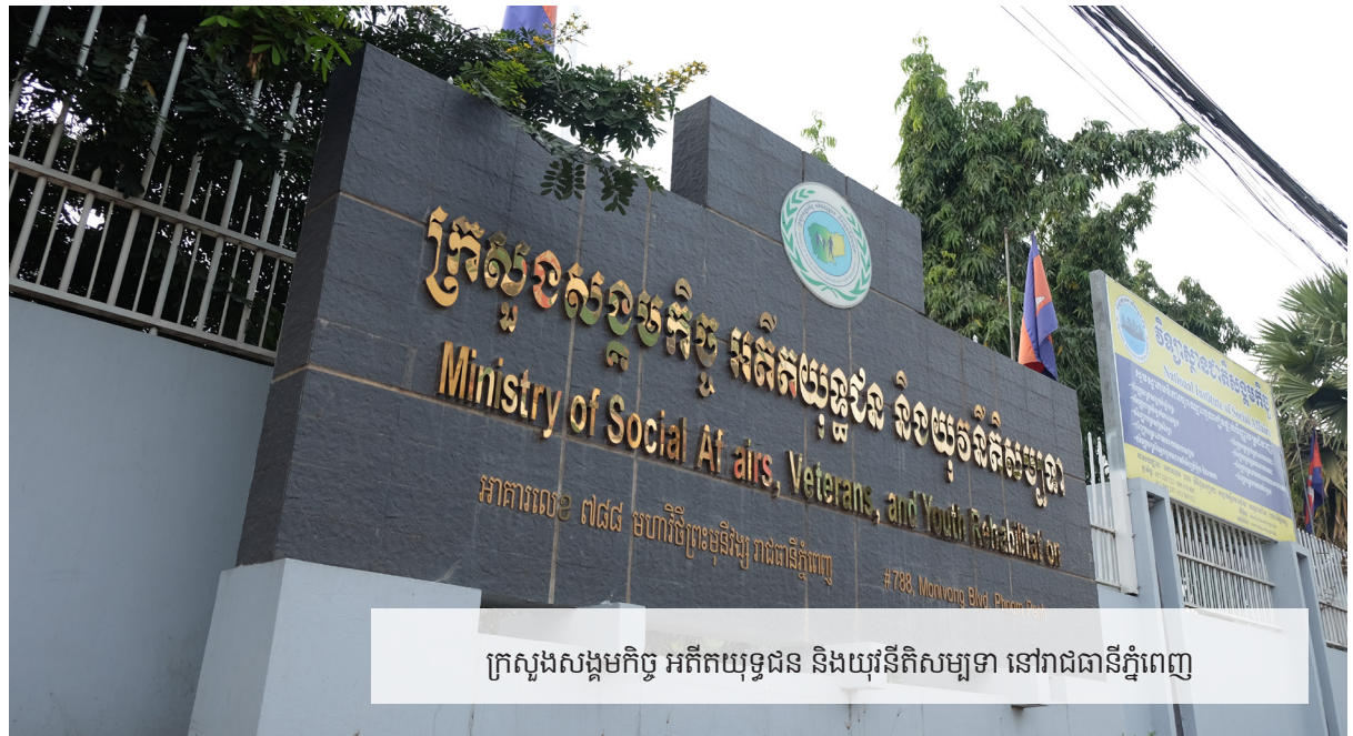
ក្រសួងសង្គមកិច្ច អតីតយុទ្ធជន និងយុវនីតិសម្បទា នៅរាជធានីភ្នំពេញ

ឡើង តាមរយៈក្រសួងសង្គមកិច្ច នោះទេ។ ក្តីបារម្ភអំពីការអនុវត្តខុសច្បាប់ជាច្រើន ដូចជាការលក់ទារកដែលមិនកំព្រាម្តាយឪពុក និងអំពើ ដែលត្រូវបានគេអះអាងថា ជាអំពើពុករលួយ ដែលត្រូវបានប្រព្រឹត្តដោយមន្ត្រីរាជការបានកើនឡើងយ៉ាងឆាប់រហ័ស ហើយសកម្មភាពសុំកូននេះ ត្រូវបានផ្អាកជាបណ្តោះអាសន្ន ជាច្រើនដង អំឡុងទសវត្សរ៍ឆ្នាំ១៩៩០ ដោយសារតែ បញ្ហាទាំងនេះបានកើតឡើង។ ៤