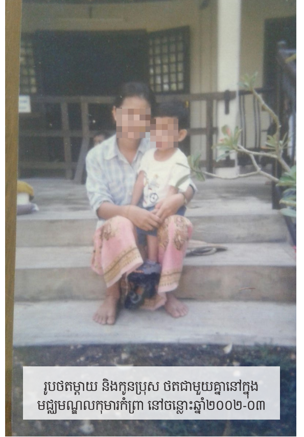
រូបថតម្តាយ និងកូនប្រុស ថតជាមួយគ្នានៅក្នុង មជ្ឈមណ្ឌលកុមារកំព្រា នៅចន្លោះឆ្នាំ២០០២-០៣

កូនជាមួយនាងទេ ឬ ក៏មិនបានស្នើឲ្យនាងចុះហត្ថលេខា លើឯកសារ ណាមួយដែរ។ ពីរបីសប្តាហ៍ ក្រោយមក ប្រធានមណ្ឌលកុមារកំព្រា បានប្រាប់ ឲ្យនាងជាម្តាយដឹង ថា ពួកគេ នឹងបញ្ជូនទារកទៅកាន់ទីក្រុងបាងកក ដើម្បី ទទួលការព្យាបាល។ ទារកនោះ បានទទួលការព្យាបាល នៅទីនោះរយៈពេលប្រហែលមួយសប្តាហ៍ ហើយបន្ទាប់ពី ត្រឡប់មកវិញ ស្ថានភាពរបស់ទារកបាន ប្រសើរឡើង