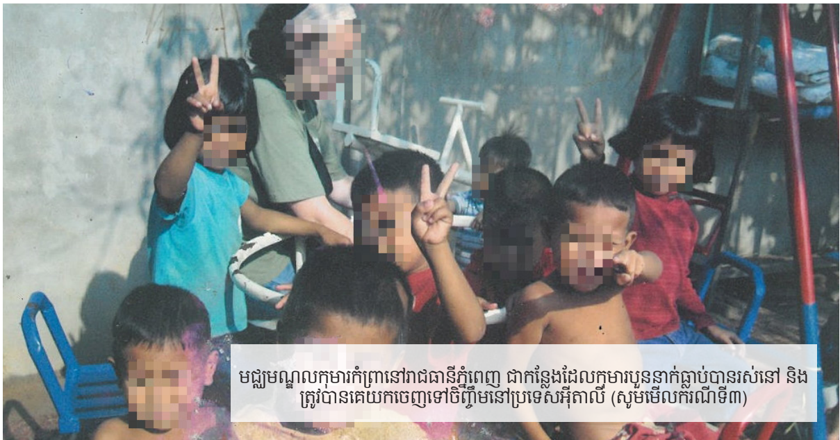
មជ្ឈមណ្ឌលកុមារកំព្រាជានៅភ្នំពេញ ជាកន្លែងដែលកុមារបួននាក់ធ្លាប់បានរស់នៅ និង ត្រូវបានគេយកចេញទៅចិញ្ចឹមនៅប្រទេសអ៊ីតាលី (សូមមើលករណីទី៣)

ចំណែកករណីទីបីគឺ ដោយសារកុមារនោះ មានជំងឺ ធ្ងន់ធ្ងរខ្លាំង ហើយត្រូវការការថែទាំ ឲ្យបានជិតដល់ដែល ម្តាយកូននោះ មិនមានលទ្ធភាពផ្តល់ឲ្យបាន ពីព្រោះស្ត្រីជា ម្តាយជាកម្មកររោងចក្រកាត់ដេរ។ មិនមានករណីណាមួយ ដែលម្តាយបានបោះបង់កូនខ្លួននោះទេ ហើយក៏គ្មាន ករណីណាដែលម្តាយទាំងនោះ បានផ្តល់សិទ្ធិឲ្យគេ យក កូនទៅចិញ្ចឹមនោះដែរ។ អង្គការលីកាដូ បានឃ្នាំមើលលើ ករណីទាំងបីនេះ និងបានរកឃើញថា សកម្មភាពសុំកូន ទាំងនេះ ត្រូវបានធ្វើឡើង ដោយការក្លែងបន្លំ និងមិន ខ្វល់ពីសិទ្ធិ និងអារម្មណ៍របស់ក្រុមគ្រួសាររបស់កុមារ។