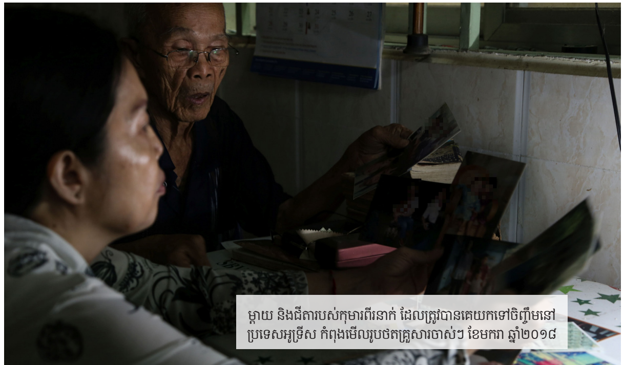
ម្តាយ និងដីការរបស់កុមារពីរនាក់ ដែលត្រូវបានគេយកទៅចិញ្ចឹមនៅ ប្រទេសអូទ្រីស កំពុងមើលរូបថតគ្រួសារចាស់ៗ ខែមករា ឆ្នាំ២០១៨

ត្រង់ចំណុចមួយចំនួននៃករណីនេះ សំបុត្រ កំណើតក្លែងក្លាយត្រូវបានបង្កើតឡើង ដែលមានដាក់ថ្ងៃខែឆ្នាំកំណើតខុស និងមិនមាន ឈ្មោះម្តាយឪពុកបង្កើតរបស់កុមារ។ នេះជាការ រំលោភយ៉ាងធ្ងន់ធ្ងរទៅលើសិទ្ធិកុមារស្តីពី អត្តសញ្ញាណ។ នេះមិនត្រឹមតែធ្វើឲ្យកុមារ យល់ ថាពួកគេក្មេងជាងអាយុពិតប៉ុណ្ណោះទេ ហើយ ថែមទាំងធ្វើឲ្យមានការលំបាកសម្រាប់កុមារ ក្នុងការស្វែងរក ម្តាយឪពុកបង្កើតរបស់កុមារ ប្រសិនបើពួកគេចង់ស្វែងរក។